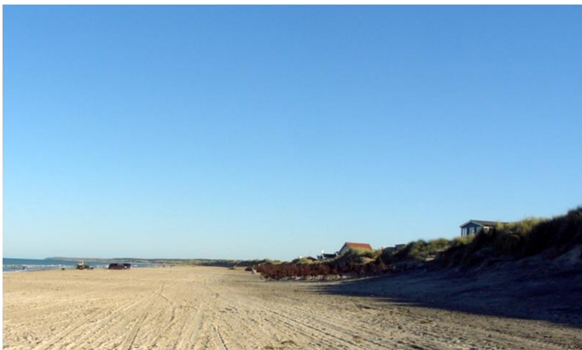
Vi ser her Nørlev strand i 2005 før trykudligningsmodulerne blev rykket op

SIC havde trykudligningsanlæg ved Skallerup klit og Nørlev Strand i perioden 2000 – 2003/5 Anlægget var en meget stor succes, som vi ser her på side 2