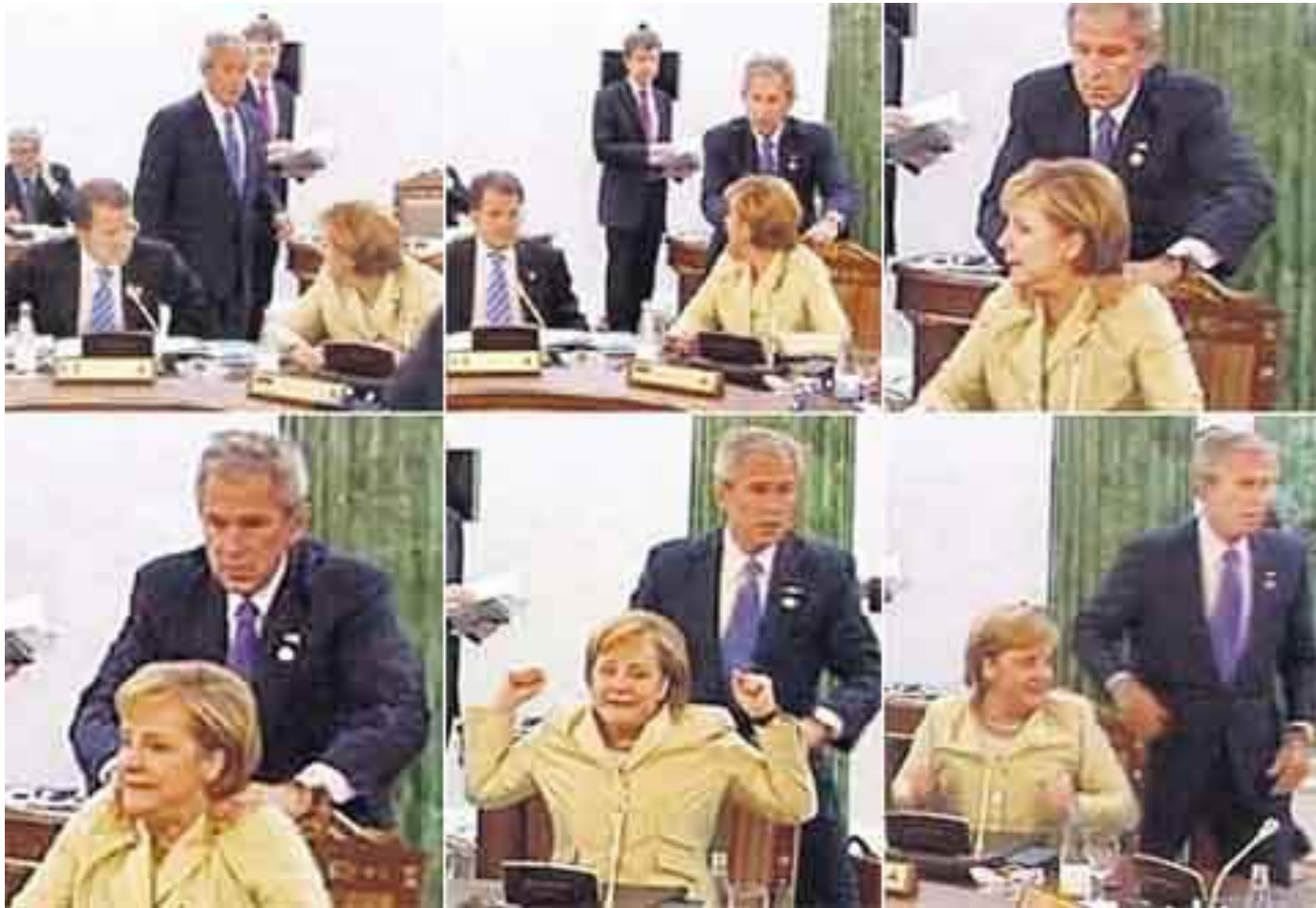
Screen capture, ZDF 2006