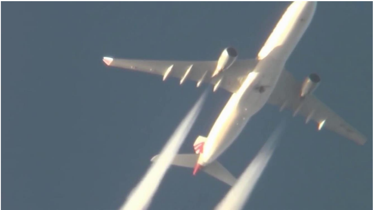
Foto: Chemtrails-fly: Dette foto er fra samme hollandske kilde som ovenstående foto af et Emirates-fly.