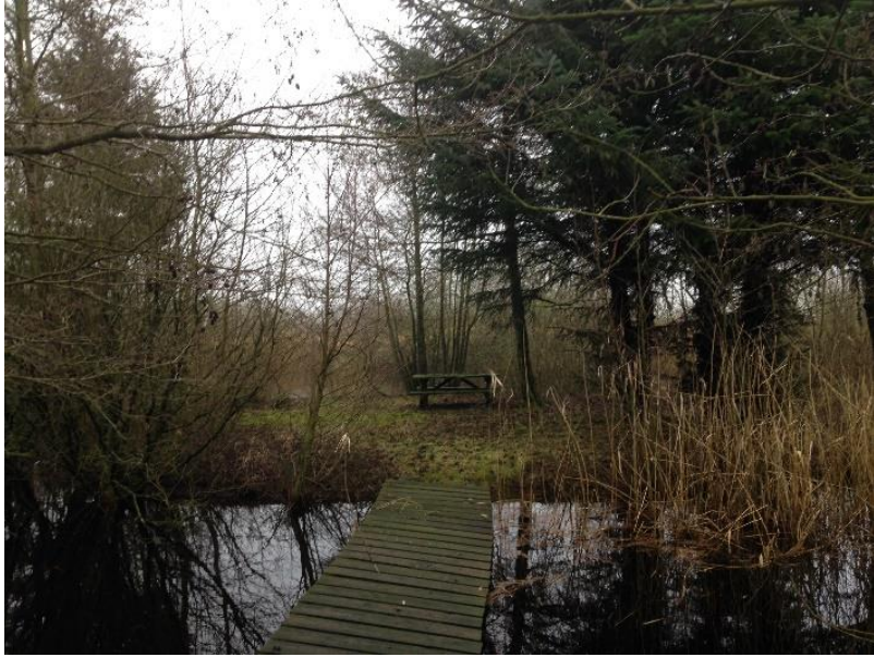
En lille fredfyldt oase fra ejendommen.