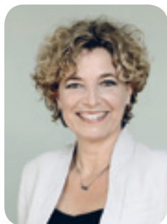
Christine Antorini Undervisningsminister

Vi skal bruge vores nordiske samarbejde til at nå endnu længere.