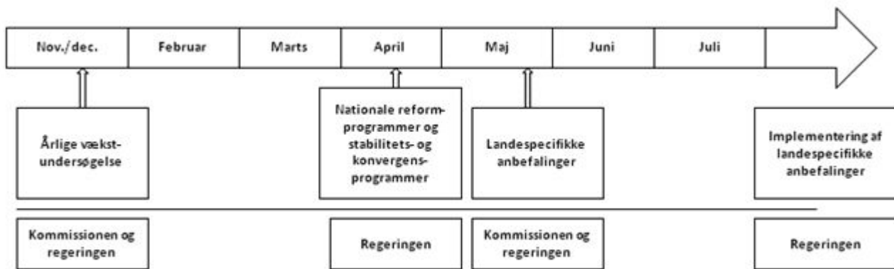
Figur 2: »Det nationale semester«

Derudover kan de to udvalg invitere de økonomiske vismænd og/eller repræsentanter for Nationalbanken m.fl. til at redegøre for deres økonomiske vurderinger.