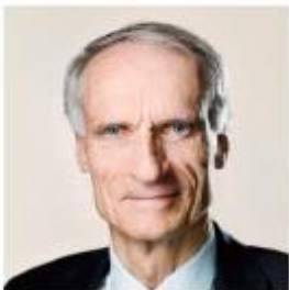
Bertel Haarder MF, Formand for Nordisk Råds danske delegation