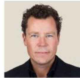
Morten Helveg MEP, ALDE Radikale Venstre