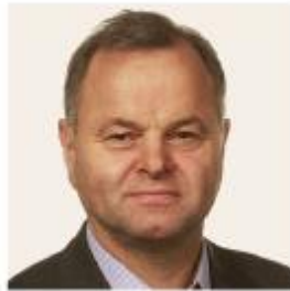
Olemlc Thommessen Stortingspræsident og formand for Foreningen Norden Norge