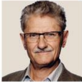
Mogens Lykketoft MF, Folketingets formand