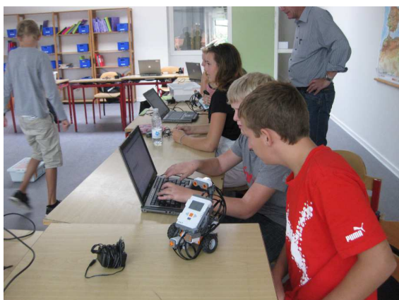
Billeder fra undervisningen – innovationslinjen på Erritsø Centralskole.