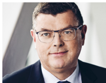
Mogens Jensen Handels- og udviklingsminister

Jeg ser frem til et godt og konstruktivt samarbejde om at omsætte Danmarks udviklingspolitiske prioriteter til virkelighed. Til gavn for verdens fattige. Til gavn for verdens udvikling. Til gavn for os alle.