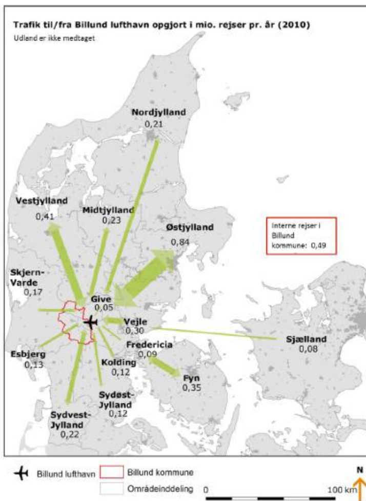
Trafikstrømme til Billund lufthavn jf. Trafikstyrelsens forundersøgelse af bane til Billund