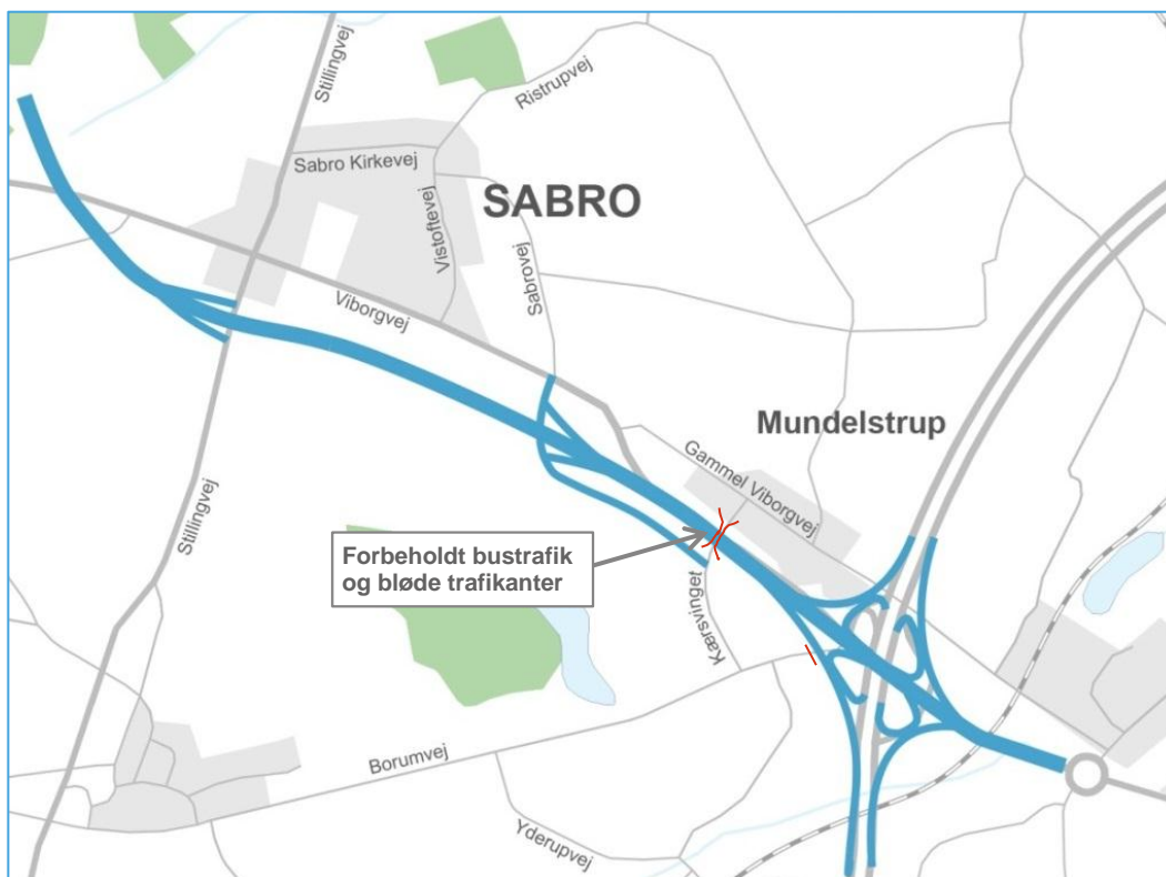
Figur 2 Udbygning af motortrafikvejen og østvendte ramper ved forlængelse af Sabrovej. Borumvej lukkes og Kærsvinget føres over motorvejen, men Vejdirektoratet anbefaler, at den forbeholdes busstrafik og bløde trafikanter.

Udbygning af motortrafikvejen er ca. 4 km lang og anlægges som 4-sporet motorvej, som beskrevet i VVM-undersøgelsen, se figur 2. Der er tilføjet ændringer efter høringen i 2012 i form af opdeling af tilslutningsanlægget ved Stillingvej, da det vil medføre en bedre trafikafvikling, reducere den gennemkørende trafik i Mundelstrup og derved øge trafikikkerheden i området mest muligt. Støjskærmen ved Mundelstrup er efter supplerende beregninger blevet forhøjet til 4 m, da det vil give den største effekt i forhold til økonomi og funktion.