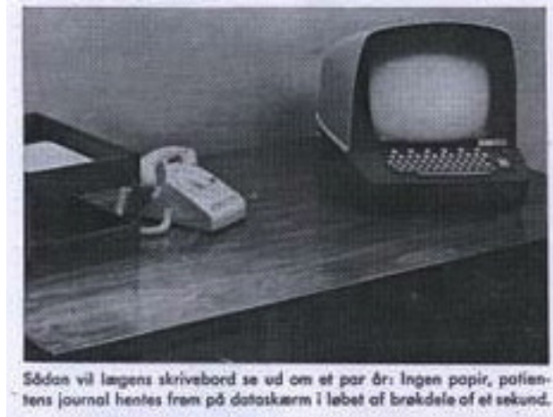
Sådan vil lægens skrivebord se ud om et par år: Ingen papir, patientens journal hentes frem på dataskærm i løbet af brøkdele af et sekund.

”Sådan vil lægens skrivebord se ud om et par år: Ingen papir, patientens journal hentes frem på dataskærme i løbet af brøkdele af et sekund.”