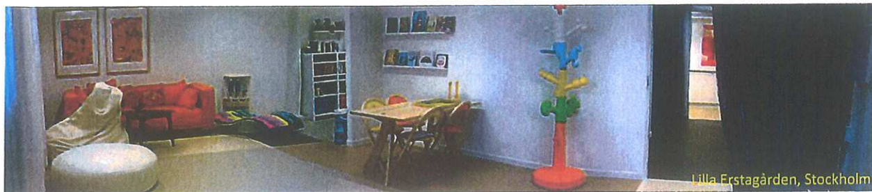
Lilla Erstagården, Stockholm