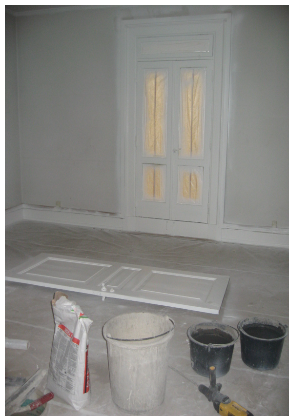
NÅR FØRST DER ER DÆKKET AF TAGER DET INGEN TID AT SPRAYMALE TRÆVÆRKET