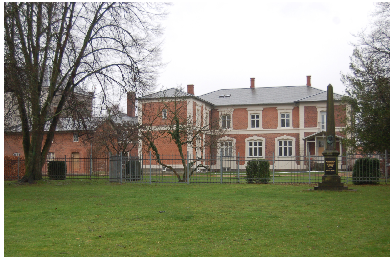
DANSK FOLKEHJÆLPS NYE HOVEDKONTOR SET FRA HAVEN.

For organisationens ansatte bliver der også tale om en væsentlig bedring af de fysiske rammer for arbejdspladsen, hvor der er blevet mere plads og bedre individuelle rammer for den enkelte ansatte.