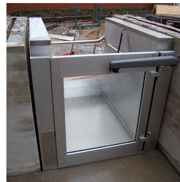
BYGNINGEN ER BLEVET HANDICAPVENLIG, SÅ DER NU ER BÅDE EN KØRESTOLSLIFT OG EN ELEVATOR.

”Det tidligere Holeby Kommune tog rigtig godt i mod os, men Guldborgsund Kommune har også været imponerende professionelle. Den kommune forstår virkelig at praktisere, at man gerne vil have folk til at bosætte sig. Vi er blevet tage imod på en god måde, hvor alle de bureaukratiske sten, der kan være på vejen, er blevet fjernet for os. Så nu vil vi, så godt vi evner det, forsøge at gøre os til et aktiv for Guldborgsund Kommune.