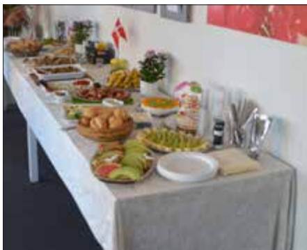
Herlev Lænkens frivillige bød på god mad i dagens anledning