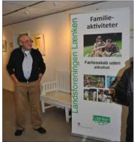
Per var på plads på Glostrup bibliotek – parat til at tale med borgerne om alkoholproblemer

Alle der deltog i dette arrangement er enige om, at det skal vi igen næste år, men måske skal vi gribe det lidt anderledes an og være endnu mere synlige. Men vi havde en rigtig fin aften.