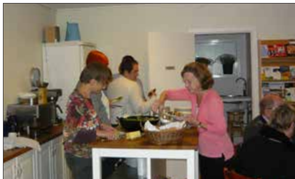
De mange fremmødte til foredraget kunne også glæde sig over en let anretning i dagens anledning.