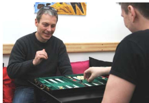
Hygge i caféen i København.