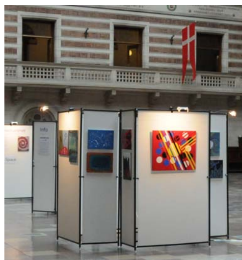
Mange indsatte deltager i Exits kunstprojekt, Export Kunst, som i september 2012 udstillede på Københavns Rådhus.