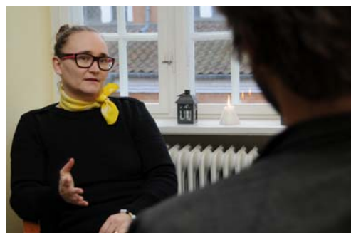
75 har haft samtaleforløb hos psykolog eller terapeut.