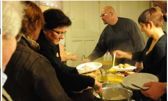
Hver måned holder Exit kultureftermiddage i Odense, Aarhus og København .