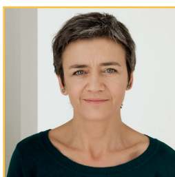
Margrethe Vestager Økonomi- og indenrigsminister