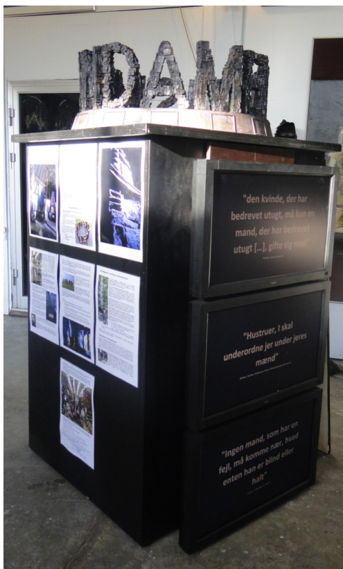
En tidlig udgave en af modellerne som bruges til at lancere projektet

Maratondebat: en museumsdirektør har foreslået, at man lader en inviteret gruppe af religiøse mennesker bo inden i og omkring skulpturen i 24 timer. De 24 timer bliver krydret med forskellige oplæg og der diskuteres og laves dialog døgnet rundt. Det hele filmes og klippes sammen til en række TV-udsendelser. En slags reality-TV, nu med mening.