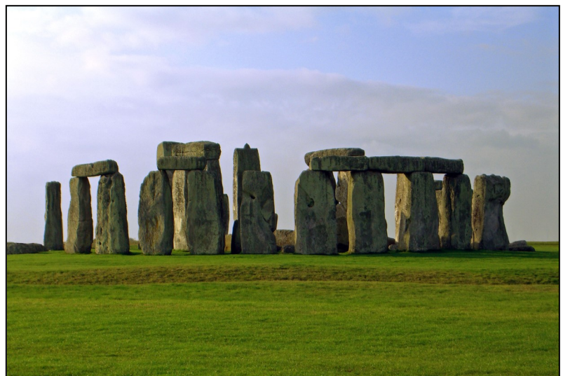
Stonehenge, 4000 år gammel, England