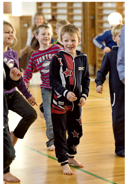
Dansekompagniet SAGA danser med elever fra Over Jerstal skole i Haderslev.