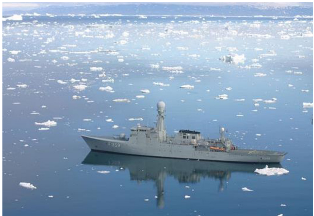
Inspektionsskibet Vædderen, som er en del af THETIS-klassen.

57. Allerede tidligt i THETIS-projektet var det ventet, at ombygningen og moderniseringen af skibene ville blive forsinket. I løbet af 2011 forventede Forsvarets Materieltjeneste, at projektet ville blive ca. 1 år forsinket. I 2012 blev det forventede tidspunkt for afslutning udskudt flere gange, og på nuværende tidspunkt forventer materieltjenesten, at det sidste skib kan leveres i 2018 med ca. 4 års forsinkelse. Materieltjenesten har ved den kvartalsvise statusrapportering for 2. kvartal 2013 oplyst, at baggrunden for forsinkelsen er, at leveringstiden for radarsystemet er længere end forventet, og at installationsfasen derfor tidligst kan indledes den 1. april 2014. Endelig er det nævnt, at typevalget af skibsbaseret helikopter har medført en større ombygning af THETIS-klassen, der ikke er en del af projektet, men som bør foregå koordineret med kapacitetsvidereførelsen.