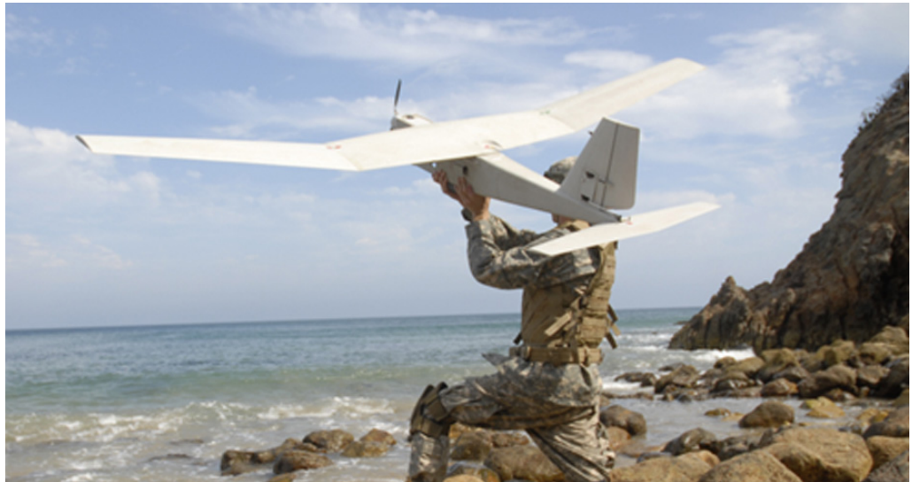
Test af én af Forsvarets droner, som er en del af Mini-UAS.

65. Antallet af Mini-UAS er nedjusteret fra 17 til 16 systemer. Justeringen i antal er begrundet i en såkaldt design to cost-tilgang, hvor et reservesystem indledningsvist udelades. Prisen har vist sig højere end oprindeligt vurderet. For at overholde budgettet har man reduceret i antallet. Forsvarskommandoen blev orienteret om og godkendte denne ændring i projektindholdet forud for kontraktindgåelsen. Forsvarsministeriet skønner, at dette ikke har nogen direkte operativ betydning.