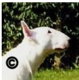
Bull Terrier registreret i Dansk Kennel Klub Danmark