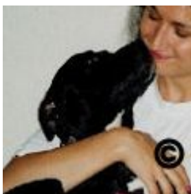
American Pitbull Terrier registreret i United Kennel Club USA

Bull Terriers figurerer ikke på forbudslisten, og den adskiller sig eksteriørmæssigt markant fra de korthårede racer på forbudslisten, idet den i henhold til racestandarden skal have et ægformet hoved. Forskellen på hovedformen på en pitbull terrier og en Bull Terrier illustreres herunder (bemærk at ingen af disse hunde har været involveret i nævnte episoder):