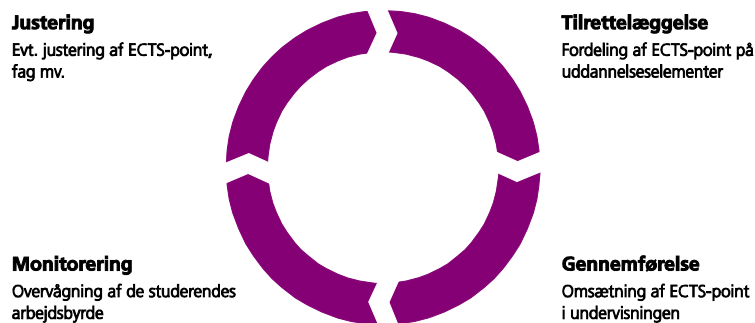
Figur 2 Fire faser i fastsættelsen af ECTS-point

Figuren viser, at fastsættelsen ideelt set bør foregå som en løbende proces, der er forankret hos alle aktører og i alle uddannelsesdele. Dvs. at studerende, undervisere og uddannelsesledere er engagerede i fastsættelsen af ECTS-point i såvel tilrettelæggelse, gennemførelse, monitorering som justering både for mindre uddannelsesdele som moduler eller semestre og for hele uddannelsen.