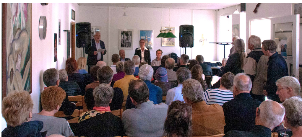
Et velbesøgt Folkemøde