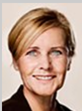
Mette Bock (LA)