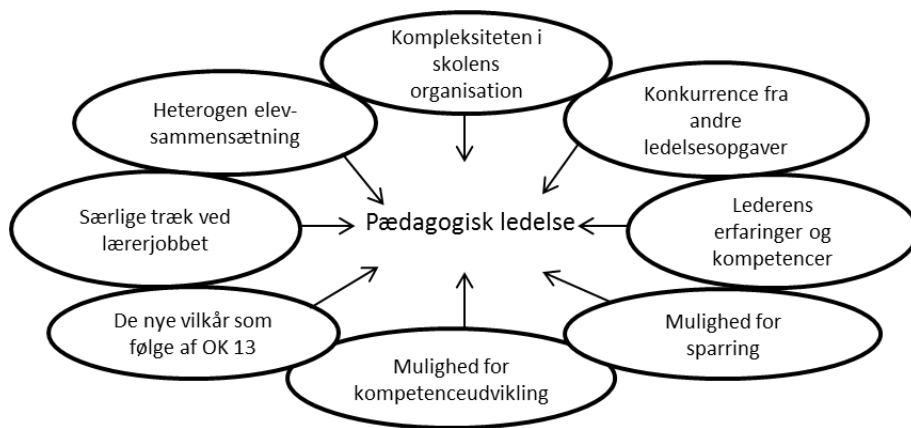
Figur 2 Forhold med betydning for pædagogisk ledelse

Figur 2 viser en samlet oversigt over forskellige typer af forhold, som opleves som betydningsfulde for pædagogisk ledelse. Nogle typer af forhold har den enkelte leder ingen eller kun begrænset indflydelse på – det drejer sig om rammeforhold som beslutningen om OK 13, de træk, som især i særlig grad kendetegner lærerjobbet, elevgruppens sammensætning og skolens organisation. Andre forhold har lederen større mulighed for selv at påvirke – selvom der selvfølgelig også vil være elementer heri, der er uden for den enkelte leders indflydelse. Det drejer sig om mulighederne for kompetenceudvikling og sparring, lederens egen sammensætning af erfaringer og kompetencer samt prioriteringen af pædagogiske ledelsesopgaver i forhold til andre dele af ledelsesarbejdet, herunder økonomistyring og administration.