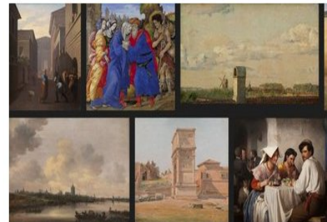
Et udsnit af museets side på Google Art Project

Som et forsøg har vi frigivet 158 af museets værker til fri download. De 158 værker er også en del af Google Art Project.