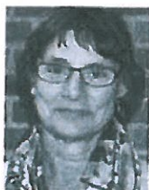
| Tekst og foto af: journalist Eva Isager |

23-årige Nick Bojer har sans for butiksjobbet, og til juni næste år bliver han fastansat af Coop.