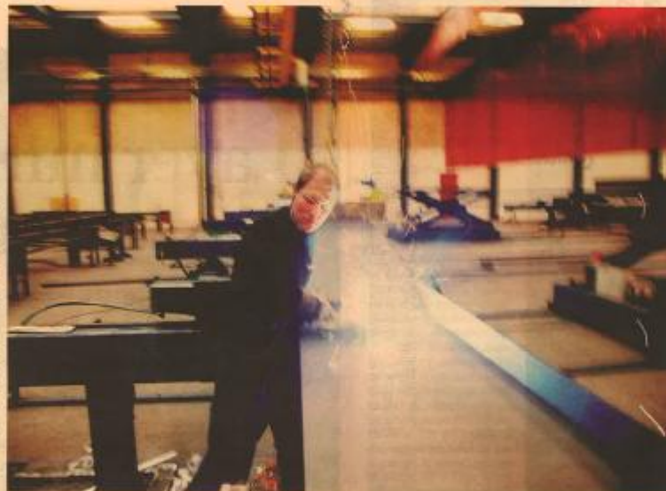
Al produktion foregår i Give Stålspærns nye effektive fabrik i Beanele.

tisk ikke nogen kø fra større lokale og i Tyskland går Give helt i tråd med buster Mogens Jensen mindst efter at øge Sydrykstand.