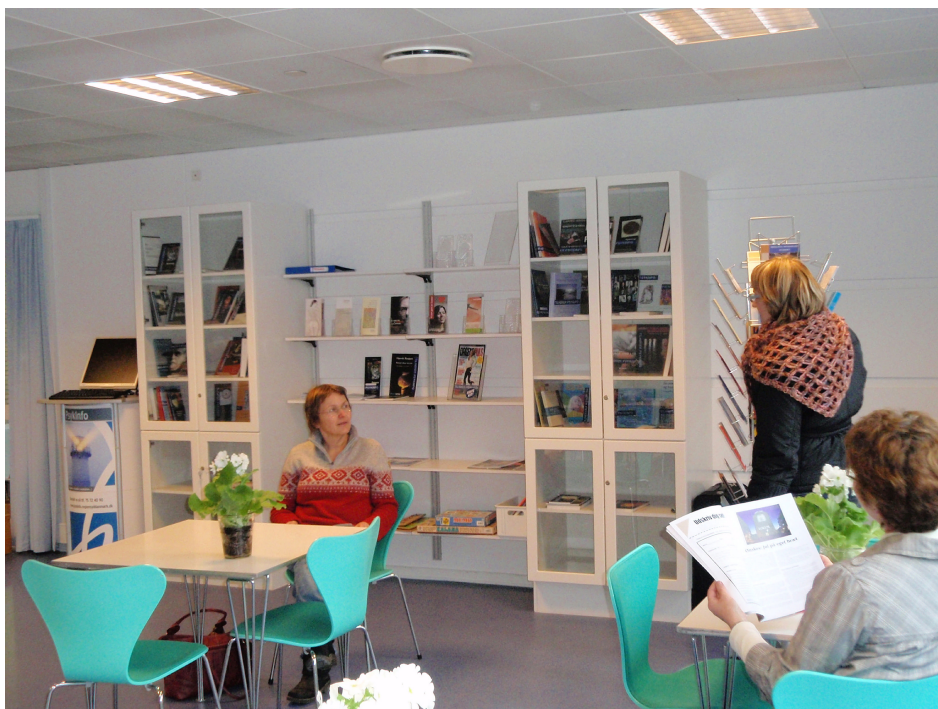
PsykInfo - caféen i forhallen - Psykiatrisk Afdeling Svendborg

PsykInfo arrangerer løbende undervisning, foredrag m.v. Se program og opslag. Du kan også finde pjecer omkring sundhed og sund livsstil i caféområdet.