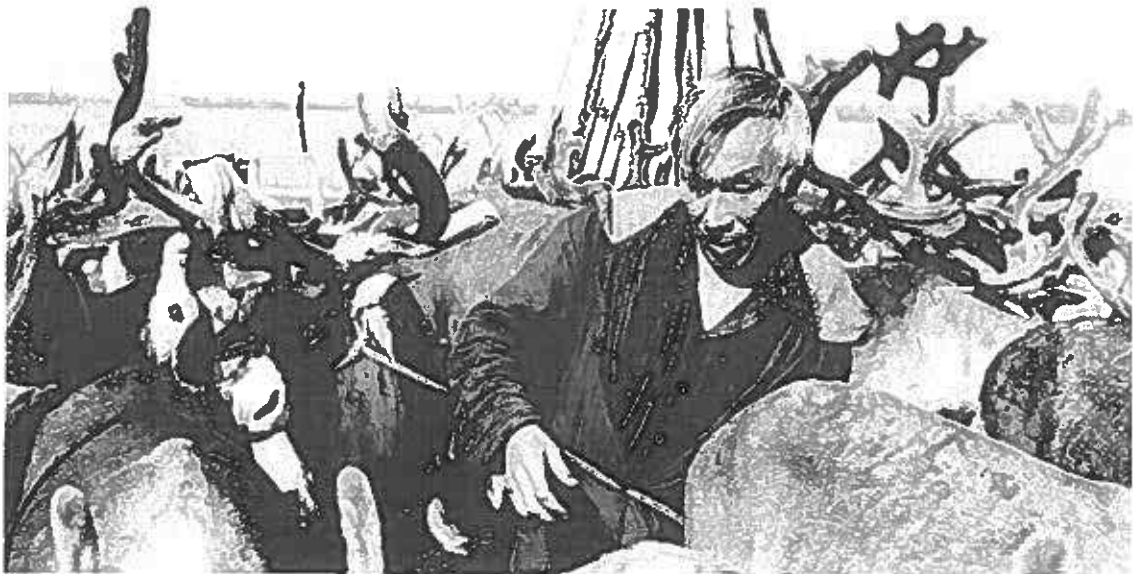
Reindeer herder in Evenkia

Russia has not ratified ILO Convention 169 and abstained from voting in the UN General Assembly on the adoption of the UN Declaration on the Rights of Indigenous Peoples.