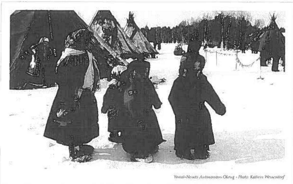
Yamal-Nenets Autonomous Okrug

In various regions, indigenous information centres have emerged, consolidated themselves and hugely improved the capacity of indigenous peoples to respond to political challenges in their regions and to threats to their land rights and livelihoods. One example is the information centre "Lach" which plays a leading role in defending indigenous peoples' right to natural resources, particularly fish, and monitors upcoming oil developments on the West coast of Kamchatka.