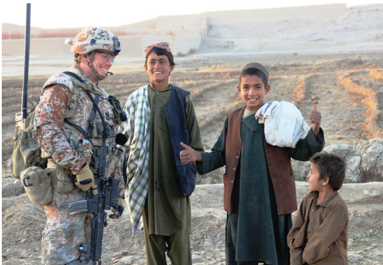
Soldat fra infanterikompagniet (B-COY) sammen med lokale børn i Nahr-e Saraj distriktet.

Helmand-provinsen er uden tvivl stadig et usikkert sted, hvor oprørerne er stærke, og hvor vejsidebomber og kampe er en trussel mod afghanernes sikkerhed og daglige liv. Det må også forventes, at oprørerne i takt med overdragelsen af sikkerhedsansvaret til de afghanske sikkerhedsstyrker frem mod 2014 vil kunne få et større spillerum og vinde en del af det terræn tilbage, som de har tabt, siden antallet af de internationale styrker blev øget markant i 2009. Sidstnævnte gælder ikke mindst i de tyndtbefolkede områder.