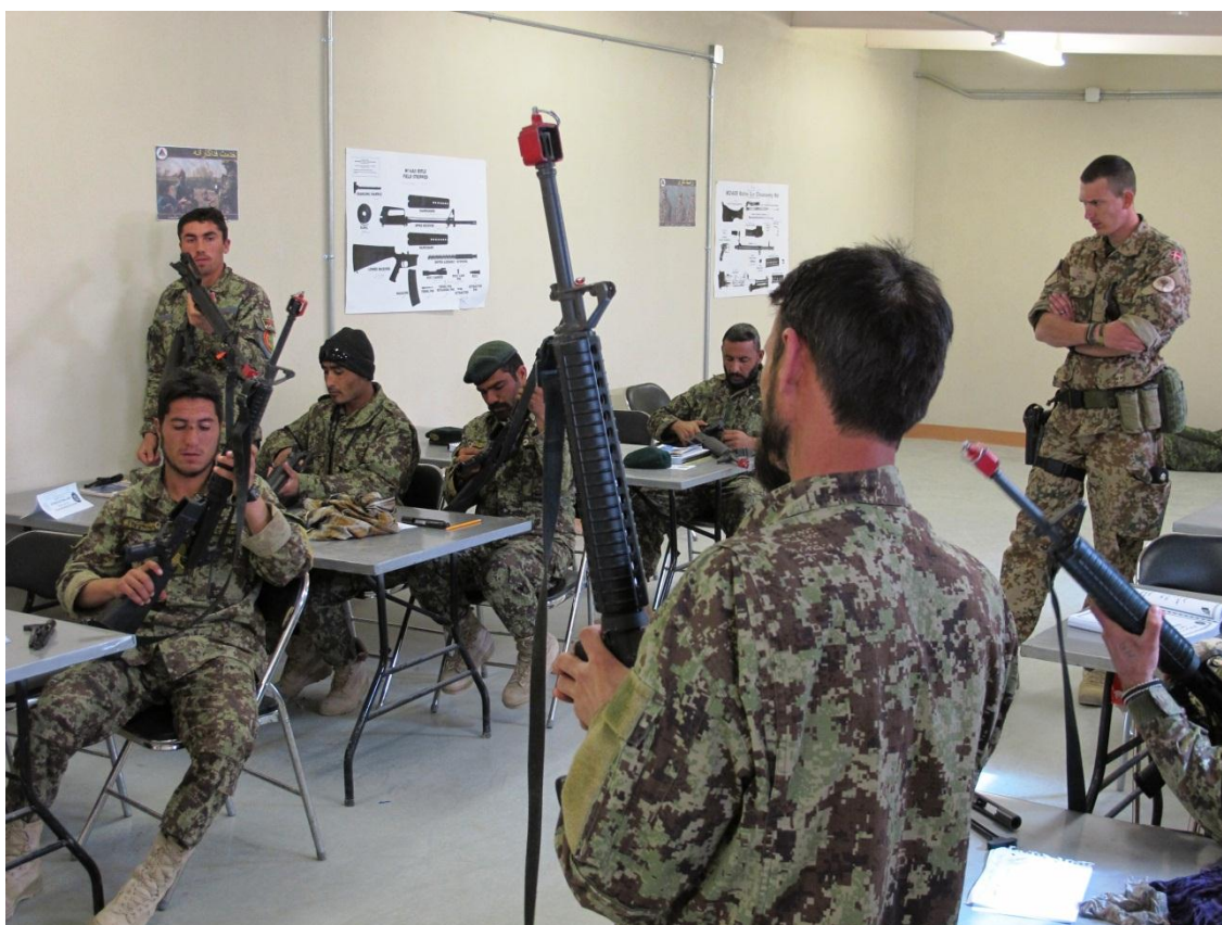
Dansk mentorering i forbindelse med våbenuddannelse ved det regionale militære træningscenter i Shorabak.

De afghanske sikkerhedsstyrker har i løbet af 2012 vist sig klar til at overtage et fortsat større ansvar for sikkerheden i landet. Med sommerens iværksættelse af tredje bølge i sikkerhedsoverdragelsen kom omkring trefjerdedele af den afghanske befolkning i andet halvår af 2012 til at leve i områder, hvor ansvaret for sikkerheden er under overdragelse til de afghanske sikkerhedsstyrker. Ved udgangen af 2012 blev fjerde bølge af sikkerhedsoverdragelsen annonceret, og transitionsprocessen forløber dermed planmæssigt. Helmand indledte transitionen i midten af 2011, og indtil nu har 10 distrikter ud af provinsens 14 distrikter påbegyndt transitionsprocessen. Der vil dog fortsat være store udfordringer og risiko for tilbageslag i tiden frem mod udgangen af 2014.