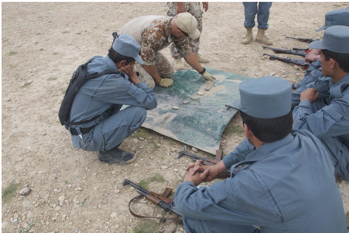
Task Force 7 mentorer instruerer Helmands specialpolitistyrke, PRC.

Danmark har gennem hele 2012 haft udsendt fire polititrænere til polititræningscentret i Lashkar Gah. Her har de blandt andet forestået undervisningen i et kursusforløb for mellemledere, der forventes at have omfattet omtrent 200 mellemledere fra Helmands politistyrke, når det afsluttes i foråret 2013. Tilbagemeldingerne fra deltagerne i de hidtil gennemførte mellemlederkurser har været positive. Ligeledes har Danmark gennem hele 2012 haft udsendt seks polititrænere til polititræningsholdene (POMLT) i Nahr-e-Saraj, hvor de har forestået mentoreringen af politiledelsen i Gereshk.