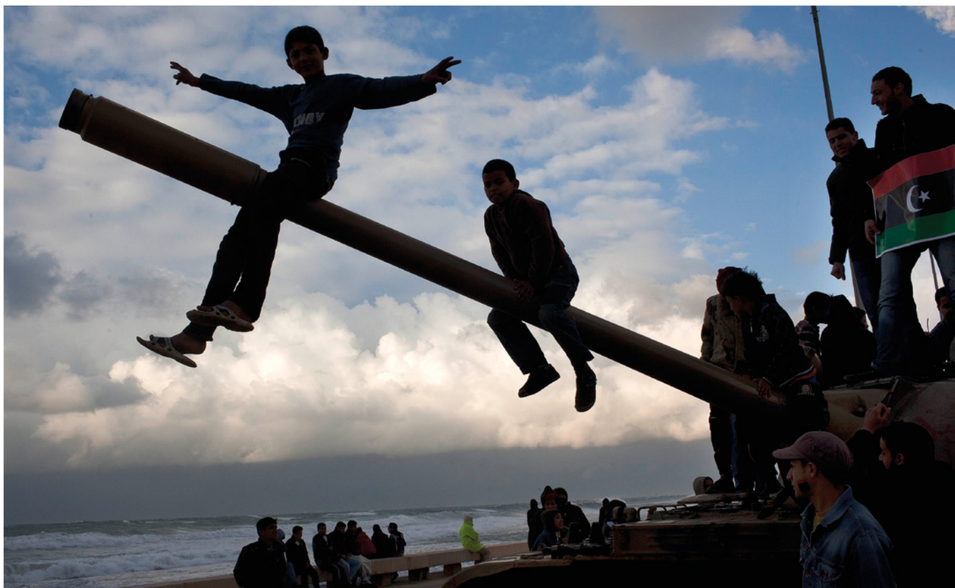
Libyske oprørere fejrer, at Benghazi er under oprørernes kontrol, 2011.