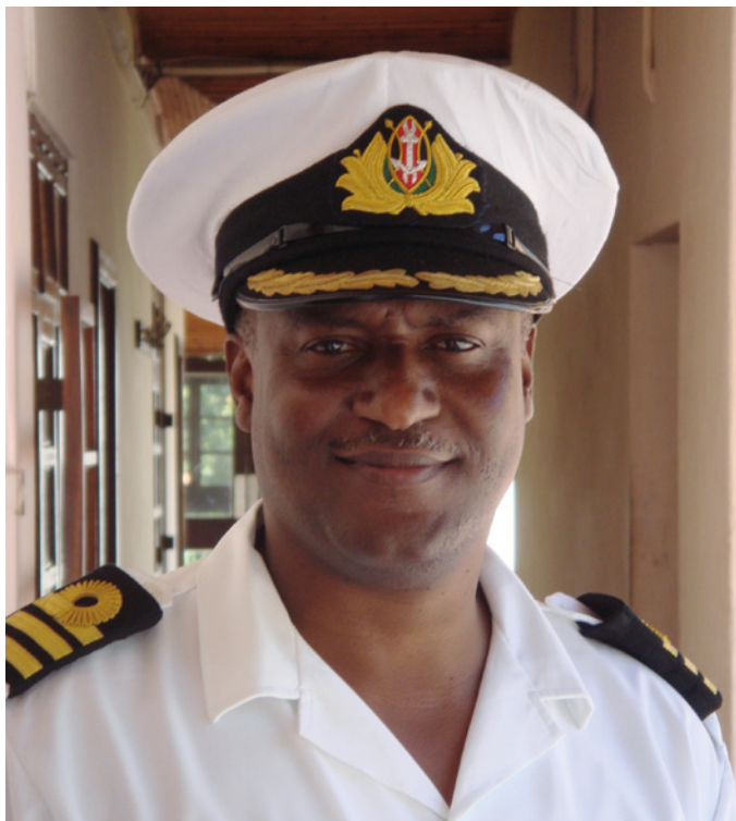
Kenyansk flådeofficer. Mombasa. Dansk-kenyansk flådesamarbejde. 2011.