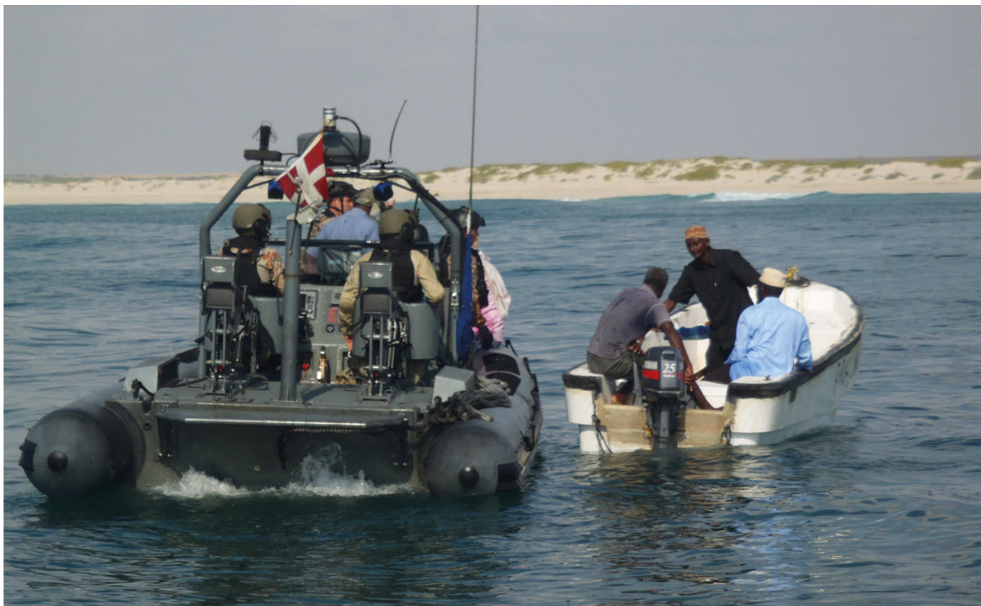
Besætning på Iver Huitfeldt i dialog med lokale ledere, Adenbugten, 2013.