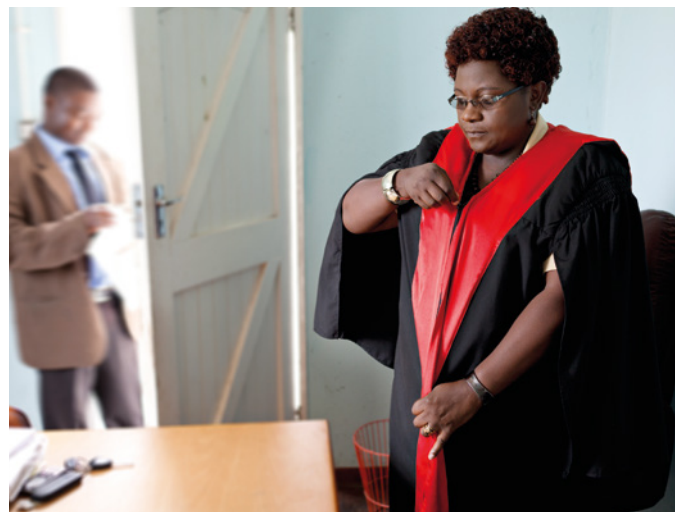
Demokratisering i Zimbabwe: Retsmøde i Magistrates Court i Murewa. 2011.

Der er en ganske betydelig indsats over den samlede, fattigdomsorienterede udviklingsbistand, der bidrager til konfliktforebyggelse og fremme af stabile og inklusive samfund. Udviklingsbistanden har blandt sine prioritetsområder fokus på stabilitet og beskyttelse, herunder på at opbygge og genopbygge vitale samfundsinstitutioner, skabe vækst og beskæftigelse og mere generelt skabe de bedste rammer for borgeres inddragelse og deltagelse i det politiske liv, hvilket skaber tillid i befolkningen til staten. Undersøgelser i Afghanistan viser f.eks., at jobskabelse og økonomisk udvikling er en topprioritet. Det internationale samfunds fælles bidrag kan her bidrage til at fremme stabiliteten og den langsigtede udvikling.