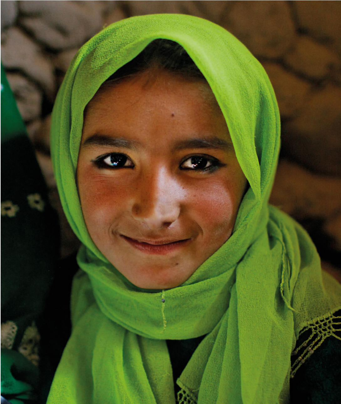
Afghansk pige , Feyzabad, Afghanistan. 2008.