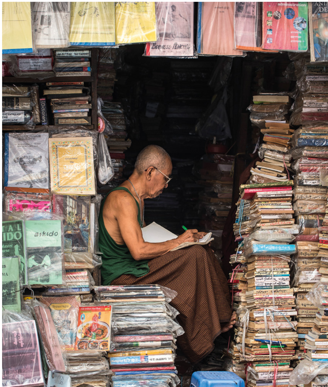
Demokratisering i Burma: Indehaver af boghandel. 2013. DANIDA.