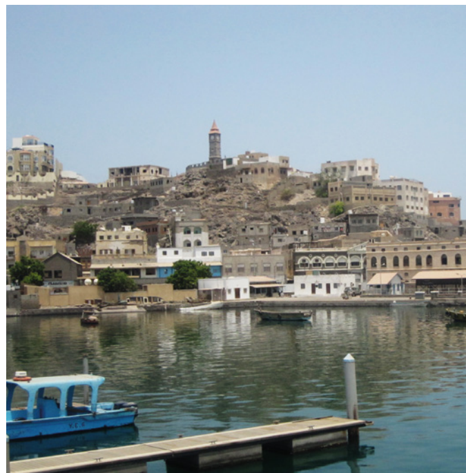
Kystvagtssamarbejde Aden Havn, Yemen, 2013.

Opbygning af legitime og repræsentative lokale og statslige institutioner er meget vigtige i forhold til at sikre stabiliseringsindsatser langsigtede holdbarhed. Ofte undervurderes vanskelighederne og tidshorizonten ved at opbygge legitime og effektive lokale institutioner og fremme inklusive politiske processer. Disse udviklingsprocesser er omfattende og kræver tålmodighed og 'et langt sejt træk'. På denne baggrund spiller kapacitetsopbygningen, bl.a. gennem forsvarrets og de civilt udsendte eksperter indsatser, en stadig større rolle. Et vigtigt element i kapacitetsopbygningen er en styrkelse af den demokratiske kontrol med sikkerhedssektoren. Støtte til retsreform (Rule of Law) er ofte afgørende for at sikre overholdelse af basale retsstatsprincipper og sikre langsigtet stabilitet.