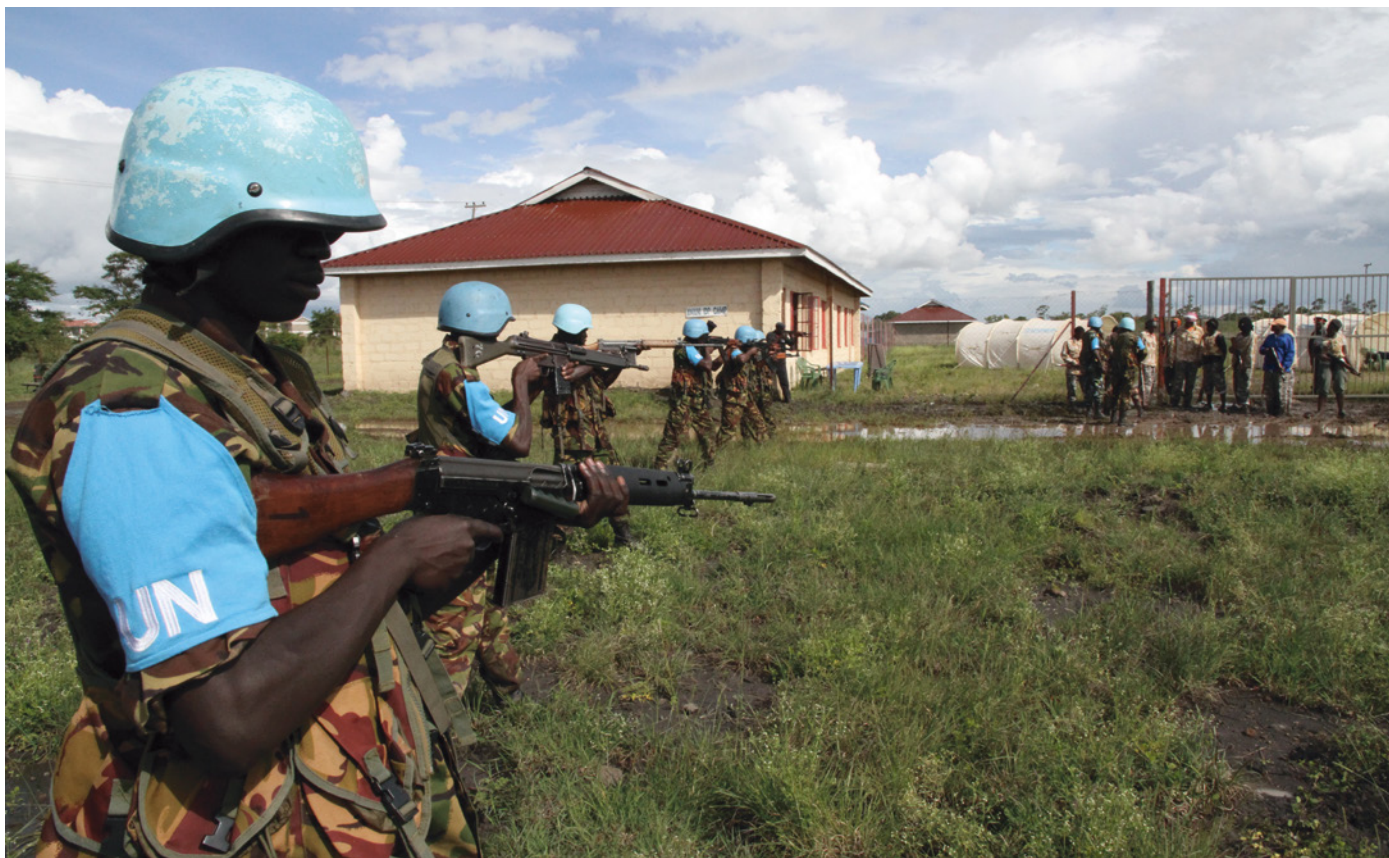
Træning af kenyanske Rapid Response styrker, 2013.