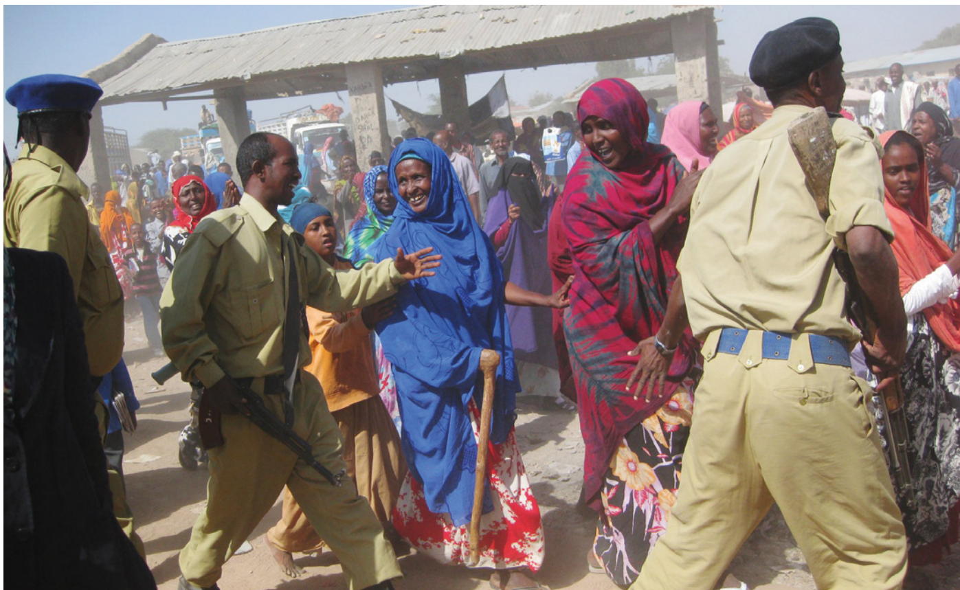
Dyremarked i Hargeisa, Somaliland, 2010.