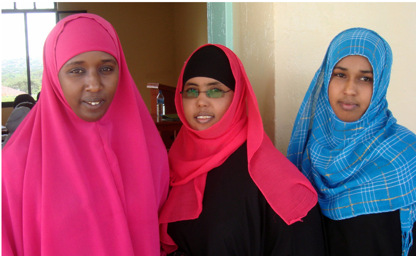
De første dimitterede kvindelige anklagere fra Hargeisa University, Somaliland, 2011.