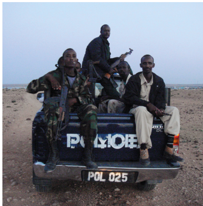
Puntland Special Protection Force , Garowe, Somalia.

Samtækningsstrukturen udgør den institutionelle, strategiske struktur i de danske samtænkte stabiliseringsindsatser, men der foregår også samtænkning på mange andre niveauer og direkte mellem forskellige aktører, uden at samtækningsstrukturen er involveret.