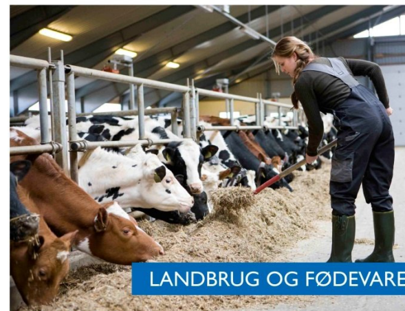
LANDBRUG OG FØDEVARER