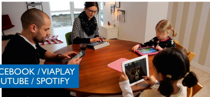
FACEBOOK / VIAPLAY YOUTUBE / SPOTIFY