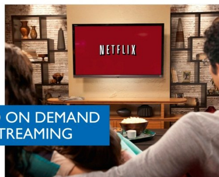
VIDEO ON DEMAND LIVE-STREAMING