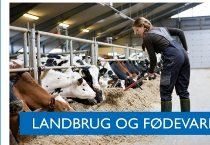
LANDBRUG OG FØDEVARER