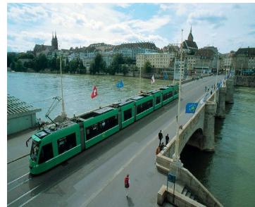
Basel Verkehrs Betriebe