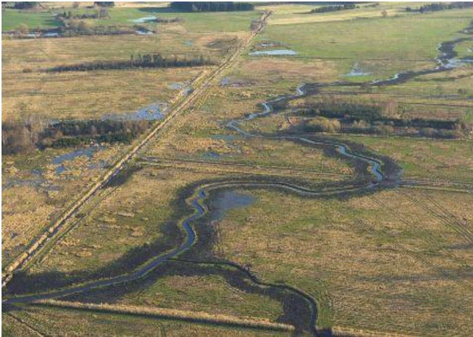
Ny natur anno 2010