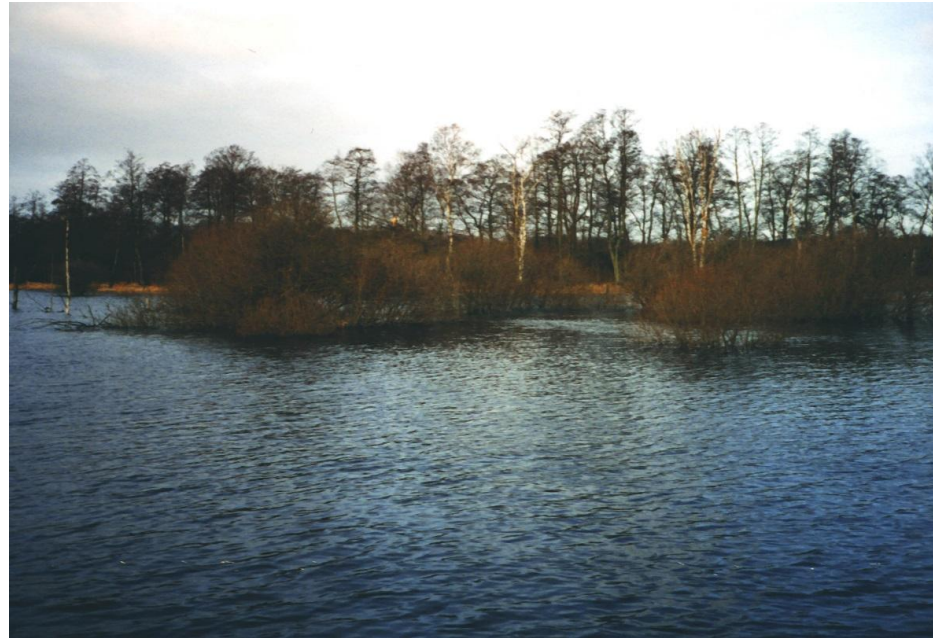
Ny natur anno 2005

Bedre løsninger = 500 mio. kr. i besparelse