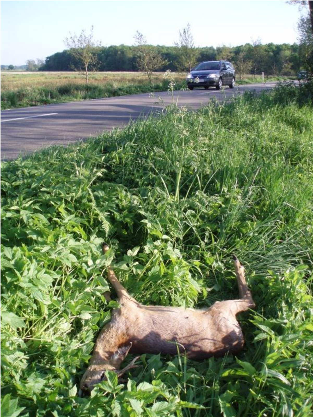
Trafikdræbt rådyr på Rødebrovej 15. maj 2008.