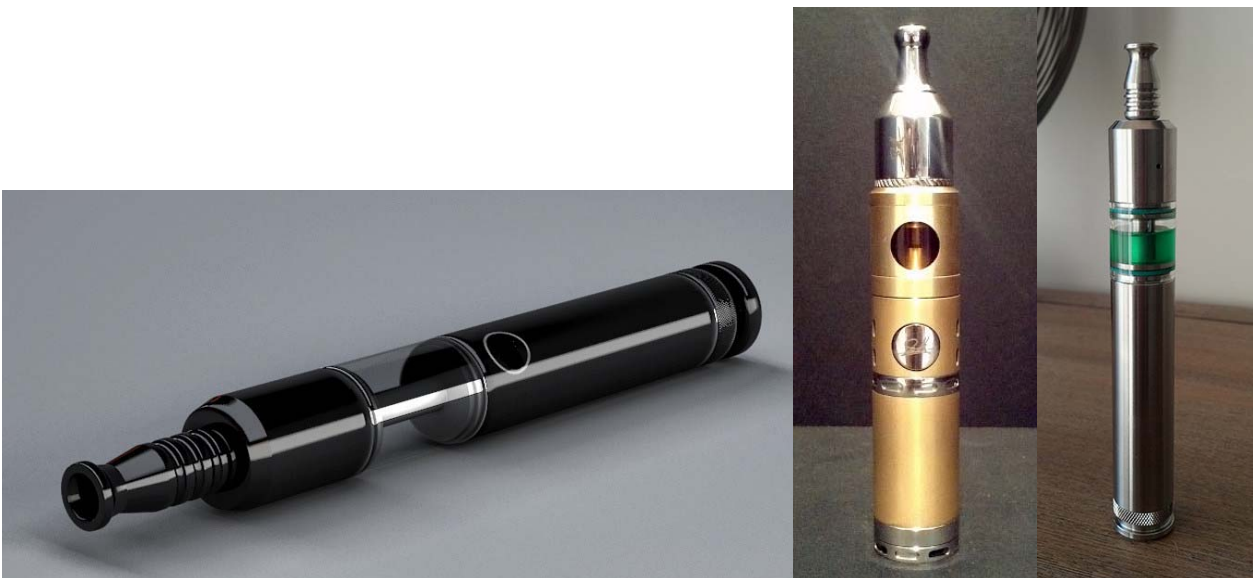
4. Avancerede modeller, som ofte anvendes af den kvalitetsbevidste forbruger og evt. som hobby

Der er som med alle andre hobbyer, gået sport i at lave så raffinerede, flotte og enkle designs som muligt. Når man først har kvittet de alm. cigaretter, så er der flere der fortsætter med at dampe, da der er dannet et tæt netværk damperne imellem, hvor man kan mødes, lave sammenligninger, udveksle erfaringer og tale om diverse udstyr og teknikker.