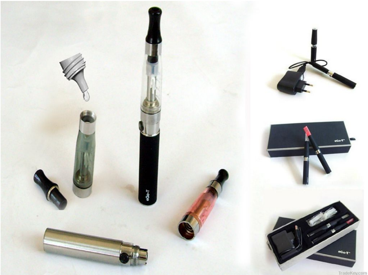
3. En af de mest anvendte modeller lige p.t. i Danmark – et eGo-batteri med en CE4-clearomizer ...