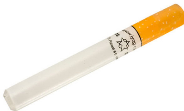
2. En af de tidlige modeller af e-cigaret