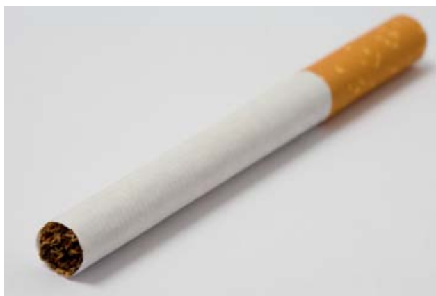
1. En alm. cigaret

De nyere modeller er mere brugervenlige (se foto 3 og 4), med genopladelige batterier der sagtens kan holde en hel dag, med tank-systemer/beholdere der kan indeholde e-væske svarende til ½-1 dags forbrug – og så er det mest af alt en miljørigtig og forsvarlig måde at dampe på. Alle dele kan genanvendes , og skilles så det nemt kan sorteres efterfølgende i plast, glas, metal og de genopladelige batterier skal selvfølgelig afleveres på genbrugspladsen.