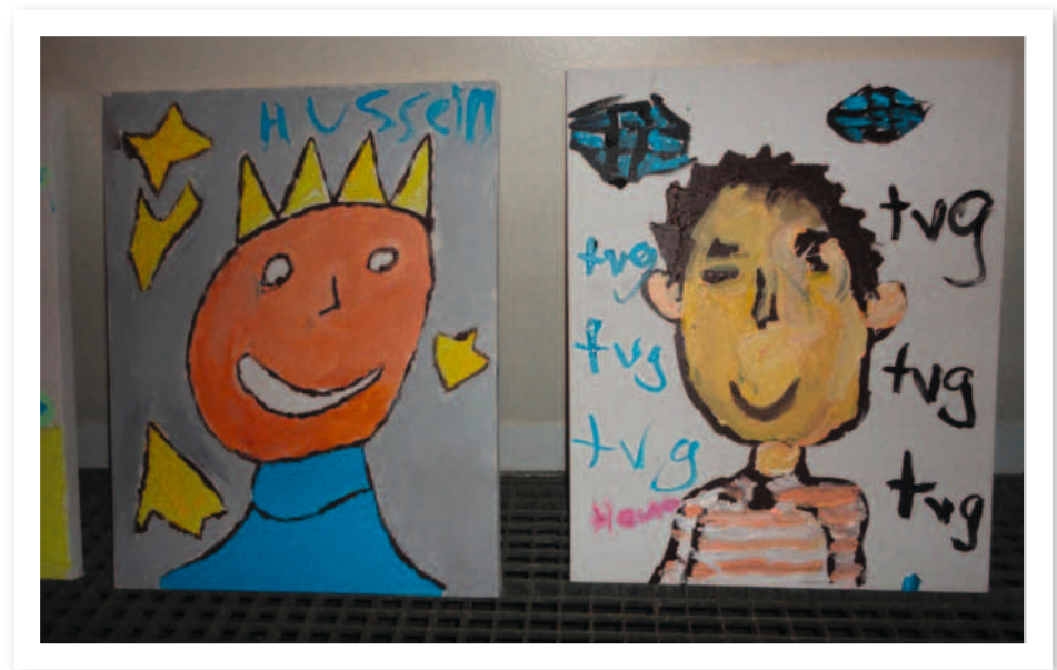
Fine resultater fra en maleraften i Mjølnerparken.