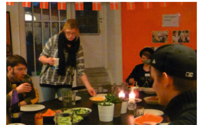
En hyggelig klubaften med fælles spising.