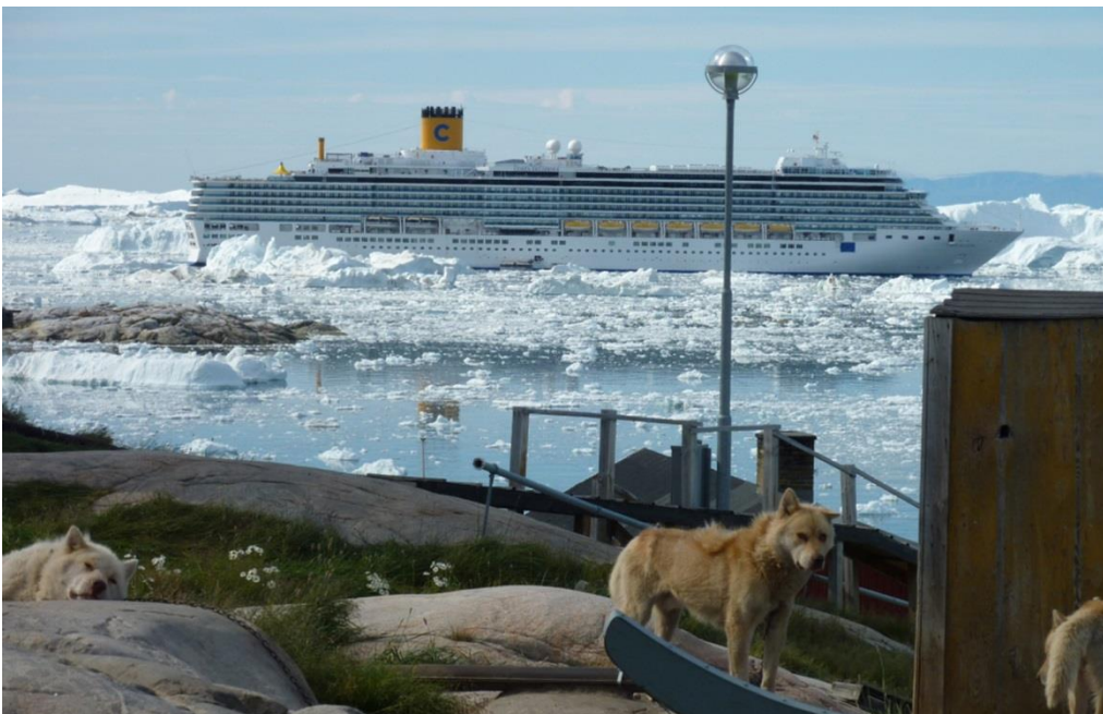
Et krydstogtskib i Disko Bugt i 2011. Skibet har plads til 3.760 personer (passagerer og besætning).

62. Arktisk Kommando har oplyst, at de ser et ændret risikobillede for SAR-operationer i Grønland, fordi der er et stigende antal krydstogtskibe, som sejler i de færøske og grønlandske farvande. I Grønland sejler krydstogtskibene fx ind i fjorde på den tyndtbefolkede østkyst, hvor der ikke er nogen infrastruktur, og hvor det kan tage flere dage for beredskabet at nå frem, hvis der er behov for det. Arktisk Kommando har oplyst, at de har iagttaget uagt-som sejlads blandt nogle af krydstogtskibene, men Arktisk Kommando kan ikke forbyde skibene hverken at sejle hurtigt eller at sejle i meget isfyldt farvand.