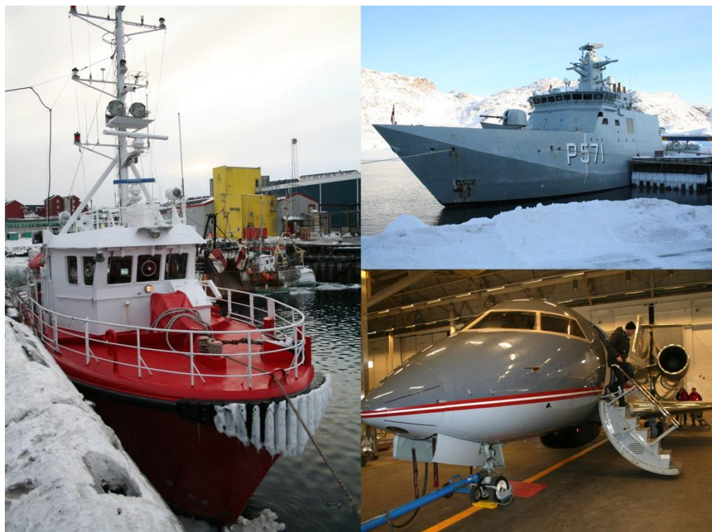
Udstyr til SAR-operationer: Til venstre: politikutter fra Grønlands Politi. Øverst til højre: inspektionsfartøjet Ejner Mikkelsen. Nederst til højre: Challenger-fly.

Justitsministeriet har indgået kontrakt med Air Greenland for at sikre adgang til Air Greenlands helikoptere, hvis det er nødvendigt til SAR-operationer. I aftalen indgår, at 2 helikoptere dedikeres til SAR-beredskabet – både til søredning og lokalredning. Det betyder, at de 2 helikoptere har kort responstid, og at de altid er udstyret med et hejseværk, der anses som centralt udstyr til at bjerge nødstedte ved SAR-operationer.