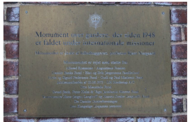
En særlig tak til donererne.