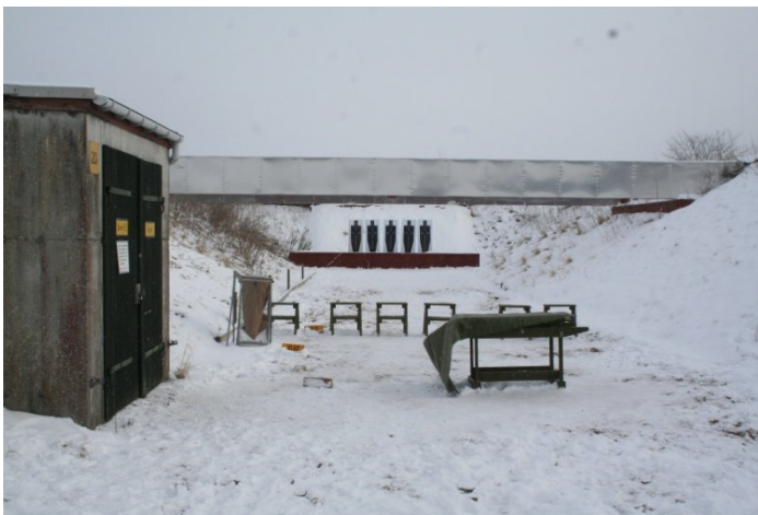
Sjælsø skydebane en ud af de to 25 meter pistolbane.