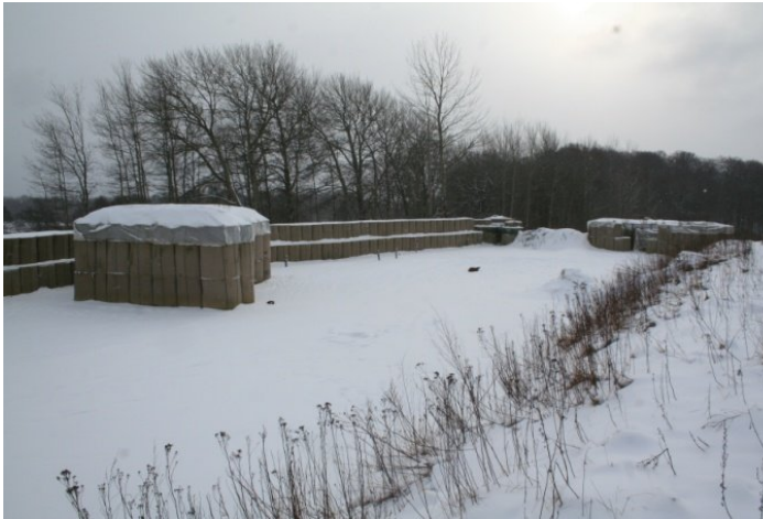
Vand, lys med mere, soverum og bunker, ligesom en INTOPS lejer.