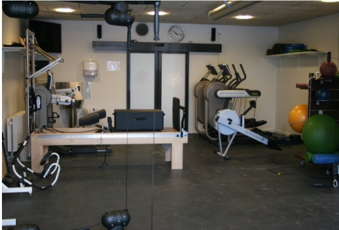
Det nye genoptræningscenter.