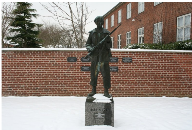
Rejst ved Livgarden i Respekt for Garderen som felt soldat.