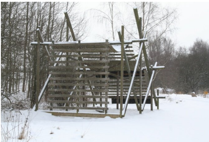
Nok den største af de 10 forhindringer på felt forhindringsbanen.