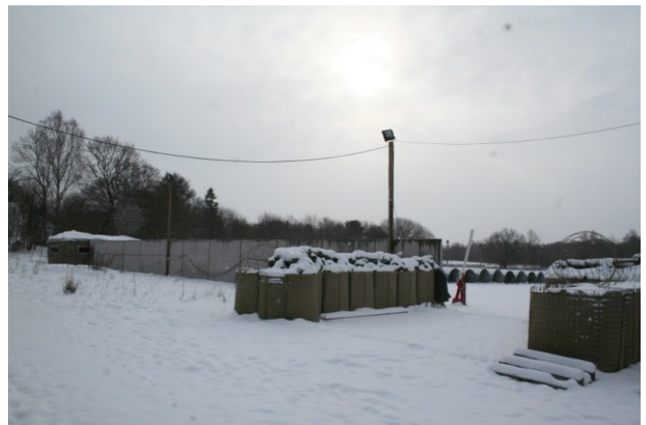
Vand, lys med mere, soverum og bunker, ligesom en INTOPS lejr