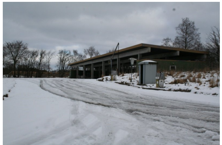
Tibben er navnet på en plads, der anvendes til styre -, bremse øvelser. Den eneste på