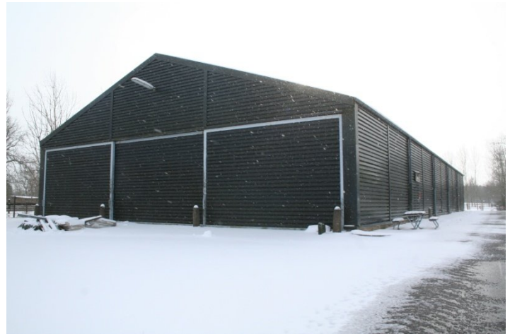
Fort Amadillo var tidligere en garagehal, men er nu ombygget og godkendt til bykampsfacilitet.