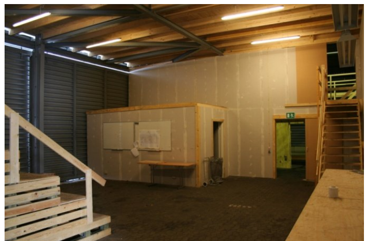
Briefing room her forberedes før aktion.