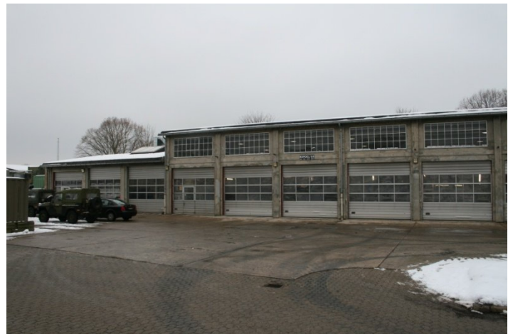
Værkstedet ved Sandholmlejer.