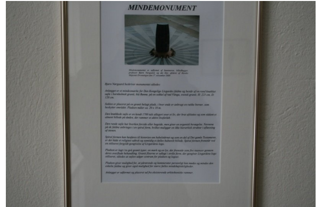
Mindemonumentet er udformet af kunstneren, professor Bjørn Nørgaard og blev afsløret af HMD den. 17. november 2009.