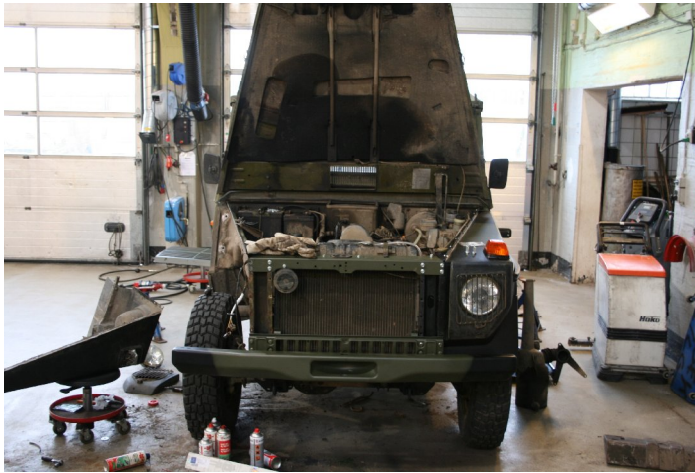
Find 5 fejl.