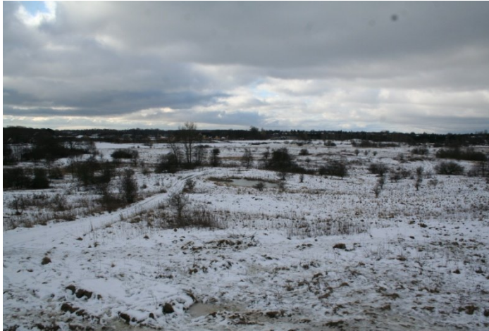
Flyvepladsen som sprængningsområde.