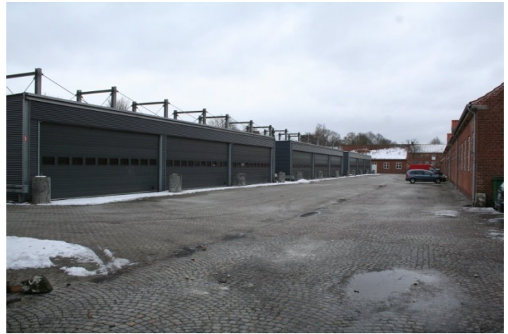
Pansrede køretøjerne. Godkendt til nuværende køretøjer samt til Hærens fremtidige pansrede køretøjer.