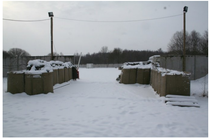
Kompagnilejren bliver flittigt brugt som uddannelsessted og opsamlingspunkt under øvelser.