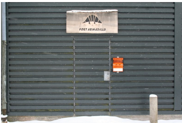
Indgangen til Fort Amadillo.