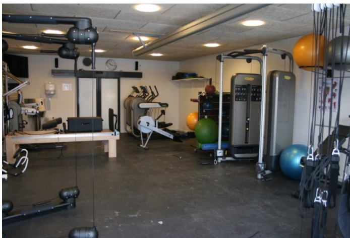
Det nye genoptræningscenter.