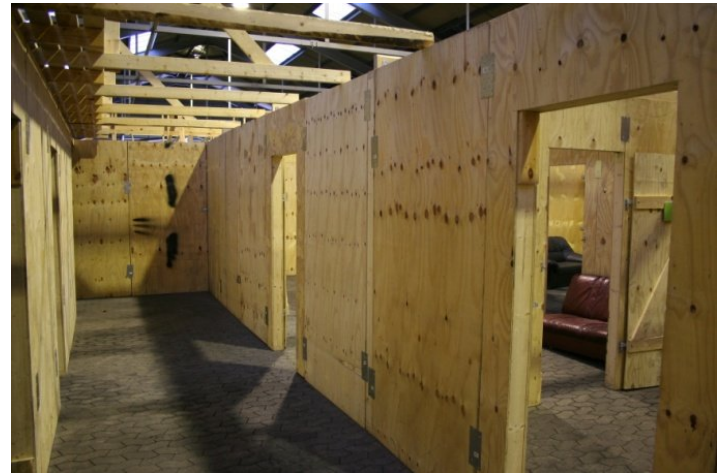
Det er aldrig til at vide, hvad der gemmer sig inden i det næste rum.