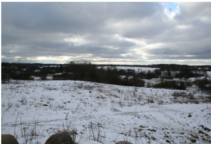
Flyvepladsen som sprængningsområde.