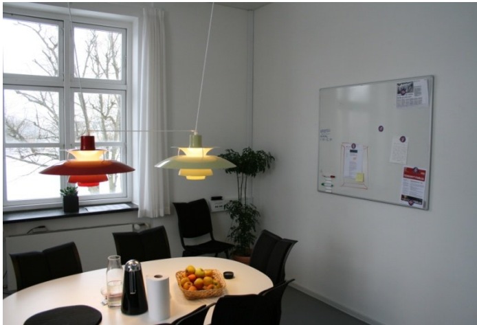
Byg. 42 som huser al rådgivning og behandling er nyligt renoveret.