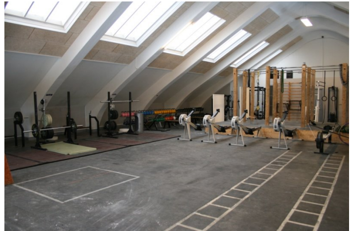
Lækkert ny istandsat fitness og styrkecenter.