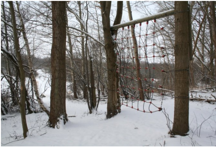
Den 1000 meter lange felt forhindringsbane byder på lidt af det hele.