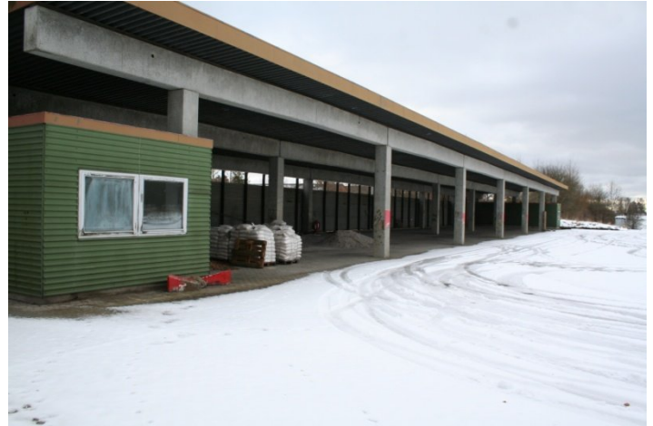
Tibben er navnet på en plads, der anvendes til styre -, bremse øvelser. Den eneste på