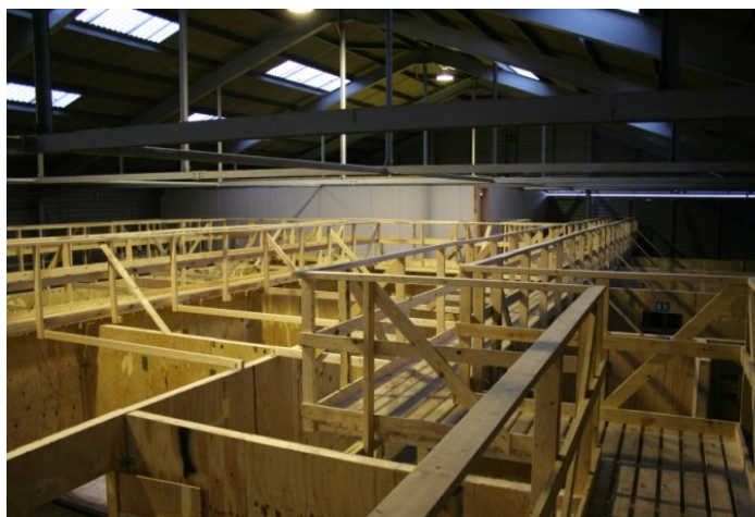
Under taget på Fort Amadillo.