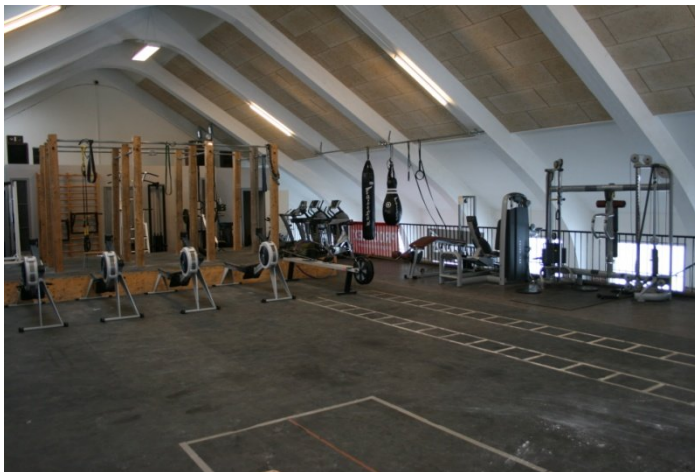
Lækkert ny istandsat fitness og styrkecenter.