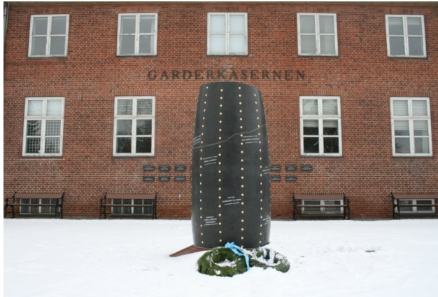
Mindemonumentet Den spiralformede søjle er til ære for de faldende ved Livgarden.