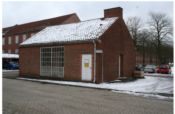
ABC rum for ophold i gas områder, der bruges af Forsvaret og Politiet.