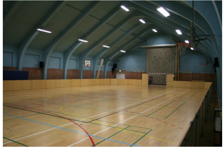
Den store gymnastiksal.