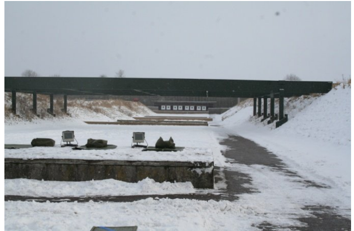
Langdistance skydebane hvor der skydes på mål mellem 50 og 200 meter.