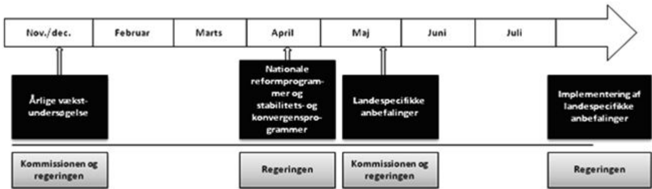
Figur 2: Det »nationale semester«

Derudover kan de to udvalg invitere de økonomiske vismænd og/eller repræsentanter fra Nationalbanken m.fl. til at redegøre for deres økonomiske vurderinger.