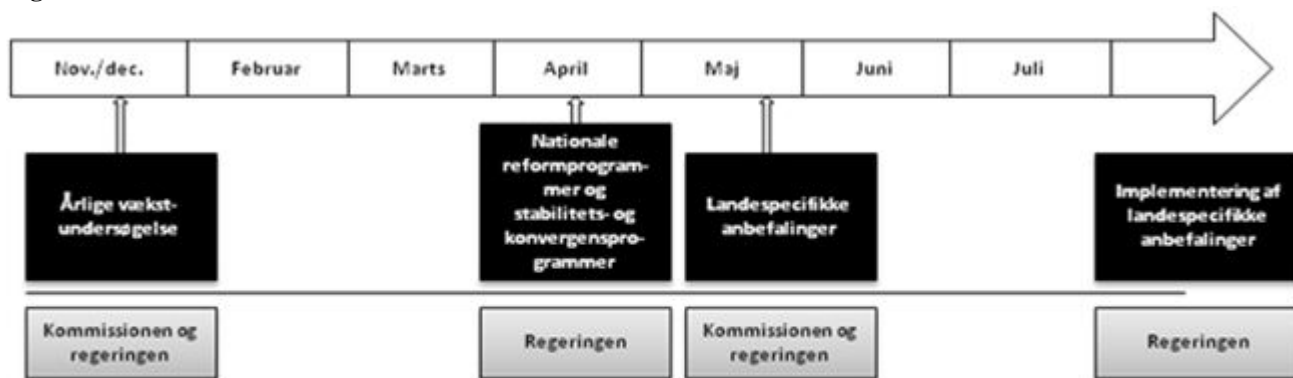
Figur 2: Det »nationale semester«

Derudover kan de to udvalg afholde høringer med de økonomiske vismænd og/eller repræsentanter fra Nationalbanken m.fl. med henblik på at nuancere Kommissionens og regeringens økonomiske vurderinger.