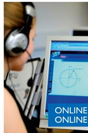
ONLINE LEKTIEHJÆLP ONLINE TUTORIALS