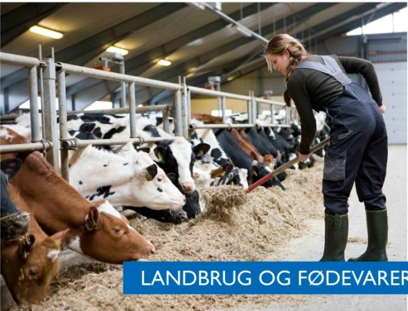
LANDBRUG OG FØDEVARER