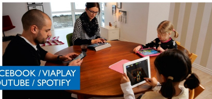
FACEBOOK / VIAPLAY YOUTUBE / SPOTIFY