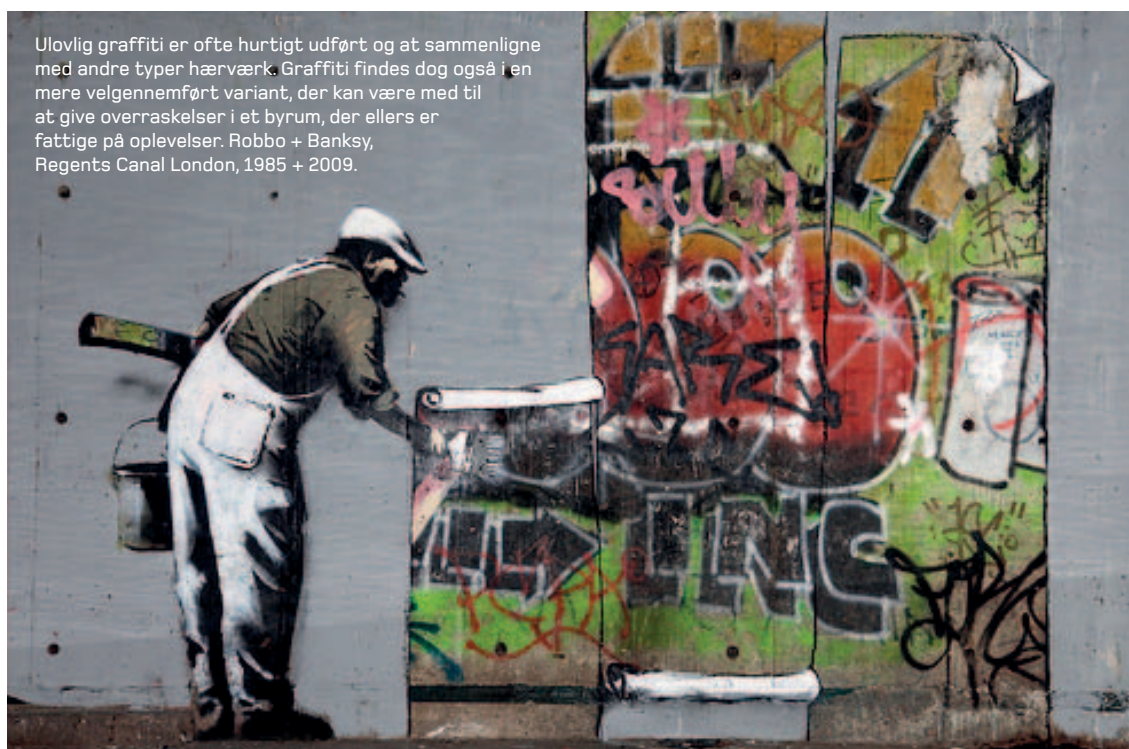
Ulovlig graffiti er ofte hurtigt udført og at sammenligne med andre typer hærværk. Graffiti findes dog også i en mere velgennemført variant, der kan være med til at give overraskelser i et byrum, der ellers er fattige på oplevelser. Robbo + Banksy, Regents Canal London, 1985 + 2009.

Udfordringen i mange udsatte boligområder består derfor i at få skabt flere og mere spredte turmål for beboerne og besøgende især om aftenen. Her er det kun fantasien, der sætter grænsen, og pointen her er da også først og fremmest, at man i tryghedsindsatser ikke behøver at arbejde med at minimere utryghed. Der ligger således store muligheder i at styrke bylivet og aktiviteterne i boligområdets offentlige rum for derigennem at øge trygheden.