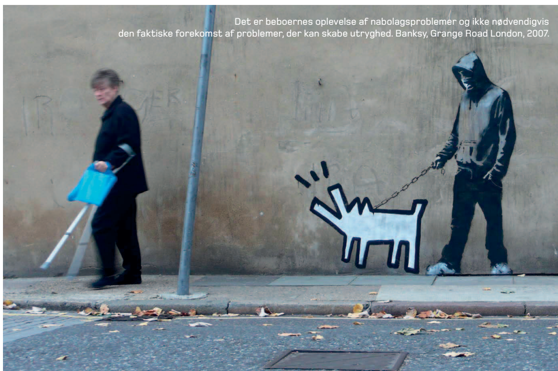
Det er beboernes oplevelse af nabolagsproblemer og ikke nødvendigvis den faktiske forekomst af problemer, der kan skabe utryghed. Banksy, Grange Road London, 2007.

Man kan som eksempel forestille sig et tilfælde af voldtægt et sted i det offentlige rum i et boligområde. Denne hændelse kan sprede skræk og rædsel blandt beboerne sandsynligvis bakket op af mediedækningen, men vejer næsten intet statistisk set. Og et andet eksempel med en voldtægt, der foregår i en lejlighed og hvor gerningsmand og offer i forvejen kender hinanden – en hændelse, der muligvis slet ikke indvirker på beboernes tryghed, selvom den i statistikken optræder som identisk med førnævnte tilfælde. Når vi så yderligere ved, at kun ca. ¼ af alle voldtægter anmeldes (Balvig & Kyvsgaard 2011:4), vil det være ren spekulation at arbejde med en vægtning af forskellige tilfælde af forbrydelser, så f.eks. vold og voldtægt slår stærkere igennem i et tryghedsindeks end f.eks. tyveri og hærværk.