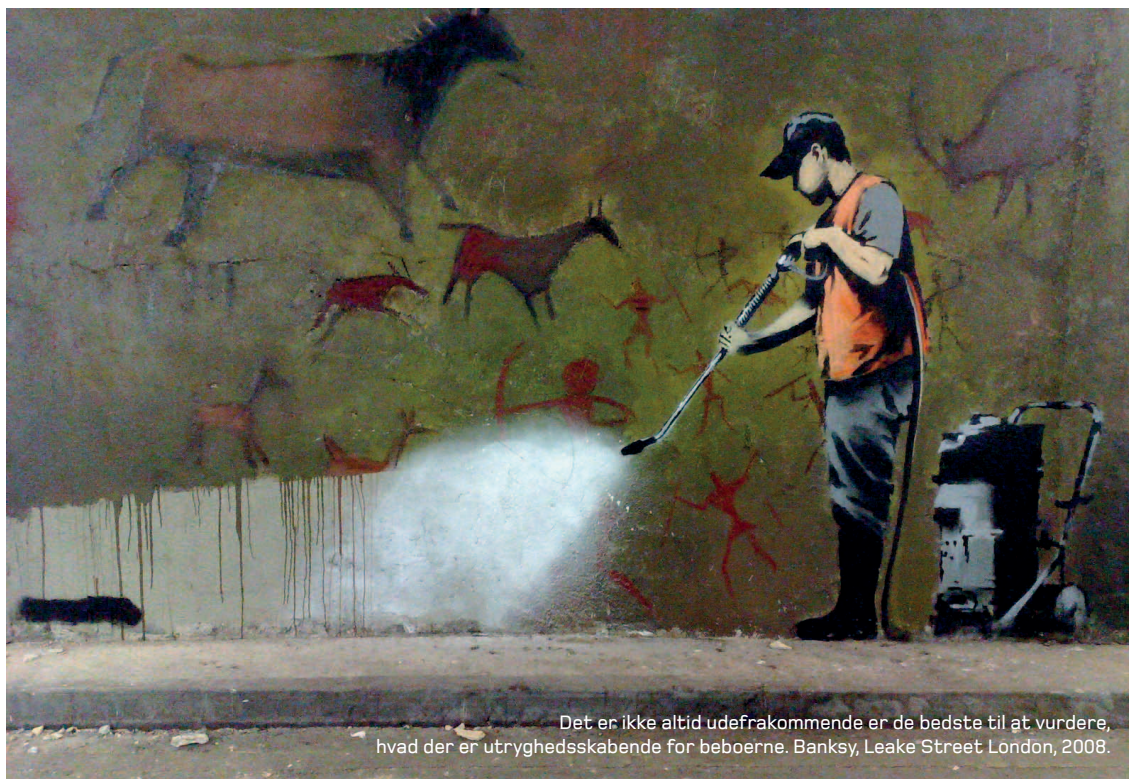
Det er ikke altid udefrakommende er de bedste til at vurdere, hvad der er utryghedsskabende for beboerne. Banksy, Leake Street London, 2008.

Overvej tidspunktet for målingerne. Da lysmængden på forskellige tidspunkter af året varierer betragteligt, påvirkes beboernes oplevelse af tryghed i forbindelse med at færdes i boligområdet. Dette skal overvejes, når en før- og eftermåling sammenlignes eller hvis der sammenlignes med andre tryghedsmålinger. Man bør derfor generelt tilstræbe, at før- og eftermålingerne foretages på samme årstid, eller alternativt om efteråret og foråret (Heber, 2008: 21).