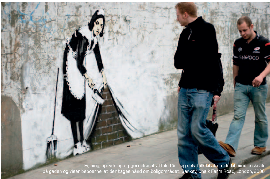
Fejning, oprydning og fjernelse af affald får i sig selv folk til at smide til mindre skrald på gaden og viser beboerne, at der tages hånd om boligområdet. Banksy, Chalk Farm Road, London, 2006.