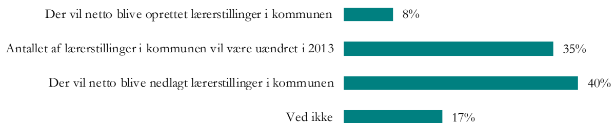
Figur 3: Hvad er kredsens forventninger til nettoændringen* i antallet af lærerstillinger i 2013?