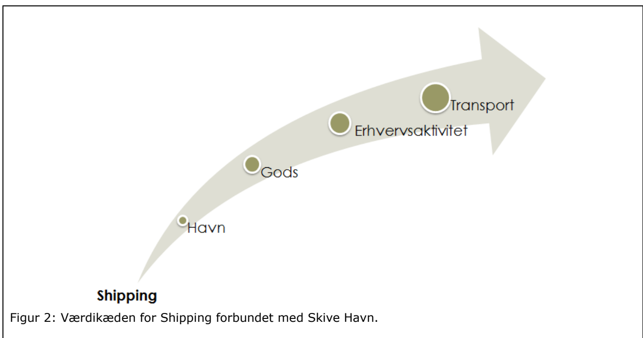
Figur 2: Værdikæden for Shipping forbundet med Skive Havn.

En betydningsfuld værdikæde på Skive Havn er shipping. Tilstedeværelsen af shipping værdikæden er medvirkende til at binde havnen sammen med de øvrige virksomheder og Kommunen. Skive Shipping er derved et centralt omdrejningspunkt for havnens liv og betydning, gennem tiltrækningen af skibstrafik.