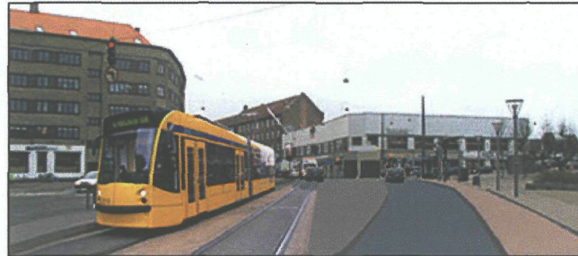
Pengene er bedre givet ud til en letbane ad Frederikssundsvej, her visualiseret ved Brønshøj Torv.