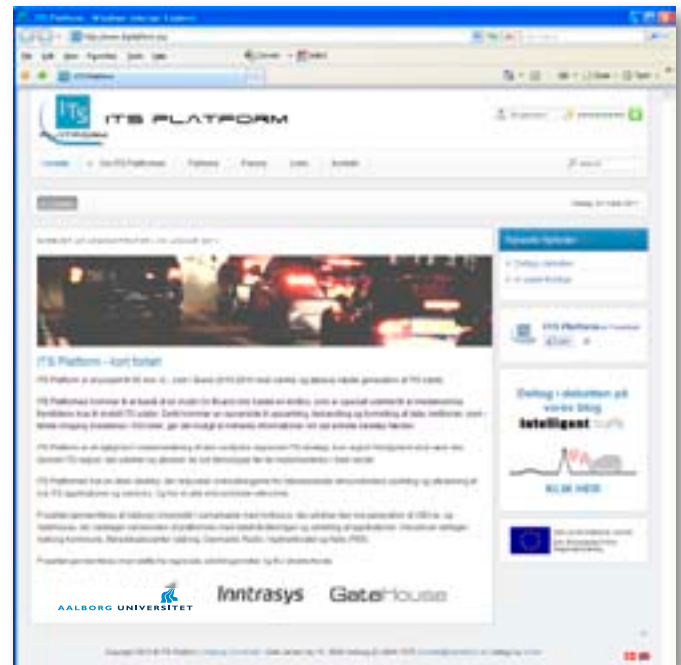
www.itsplatform.eu er en åben platform for applikationer, som hjælper bilisterne.