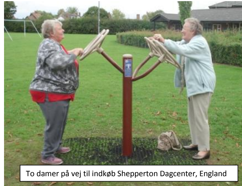
To damer på vej til indkøb Shepperton Dagcenter, England