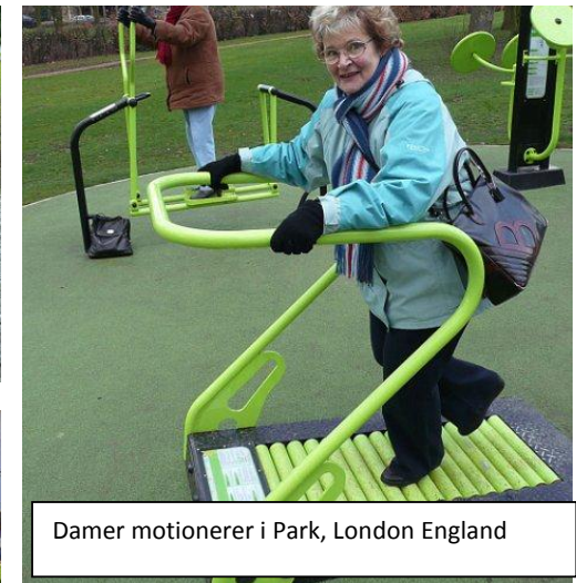
Damer motionerer i Park, London England