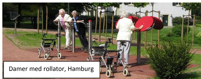
Damer med rollator, Hamburg