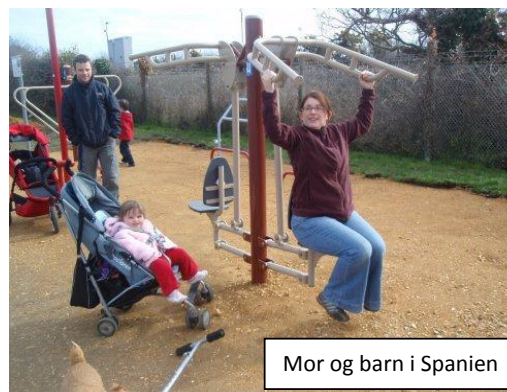
Mor og barn i Spanien