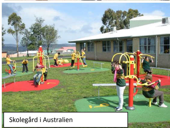
Skolegård i Australien