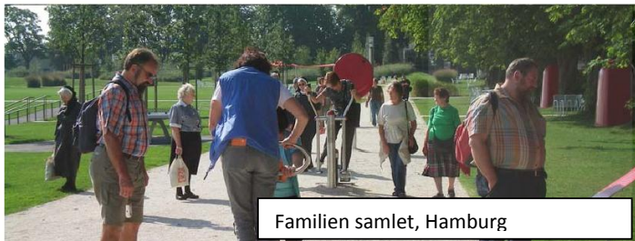
Familien samlet, Hamburg