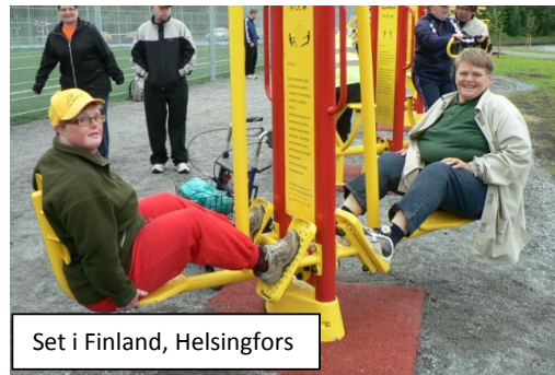
Set i Finland, Helsingfors