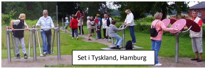
Set i Tyskland, Hamburg

Den sunde by Dokumentation af de faktorer, som påvirker sundhed i den tætte by og forstaden som led i udvikling af bæredygtig planlægning som praktiseres rundt omkring i verden.