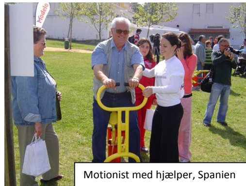
Motionist med hjælper, Spanien